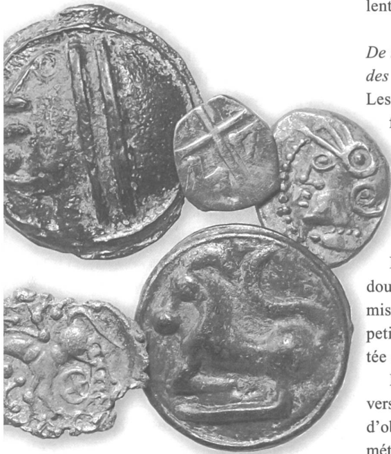
Potins (bronze coulés) dits «à la grosse tête», 2 quinaires «de KALETEDV» et une petite obole massaliote en argent.

Le lieu de culte découvert sur la colline du Mormont, à ce jour unique en Gaule, présente une des plus grandes concentrations de