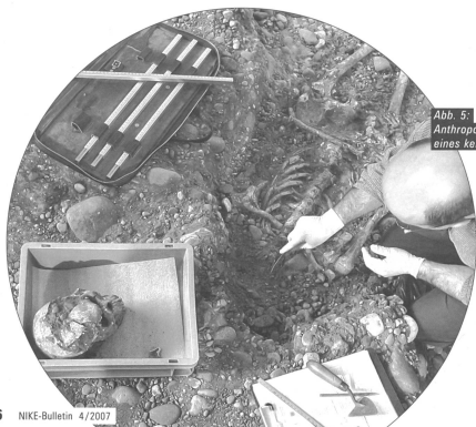
Abb. 5: Anthropologische Untersuchung eines keltischen Grabes.

Ce site datant de la fin de l'âge de La Tène a été découvert en 1911. Il fait l'objet depuis lors de fouilles scientifiques. Dans les prochaines années, il s'agira de protéger les éléments de ce site important encore enfouis dans le sous-sol et d'analyser le très grand nombre d'informations et d'objets désormais à disposition, avant de publier les résultats de ces analyses.