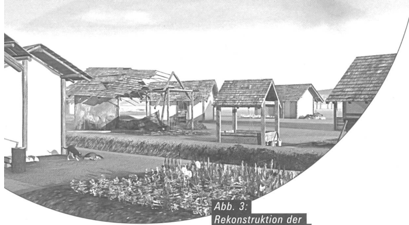
Abb. 3: Rekonstruktion der keltischen Siedlung.