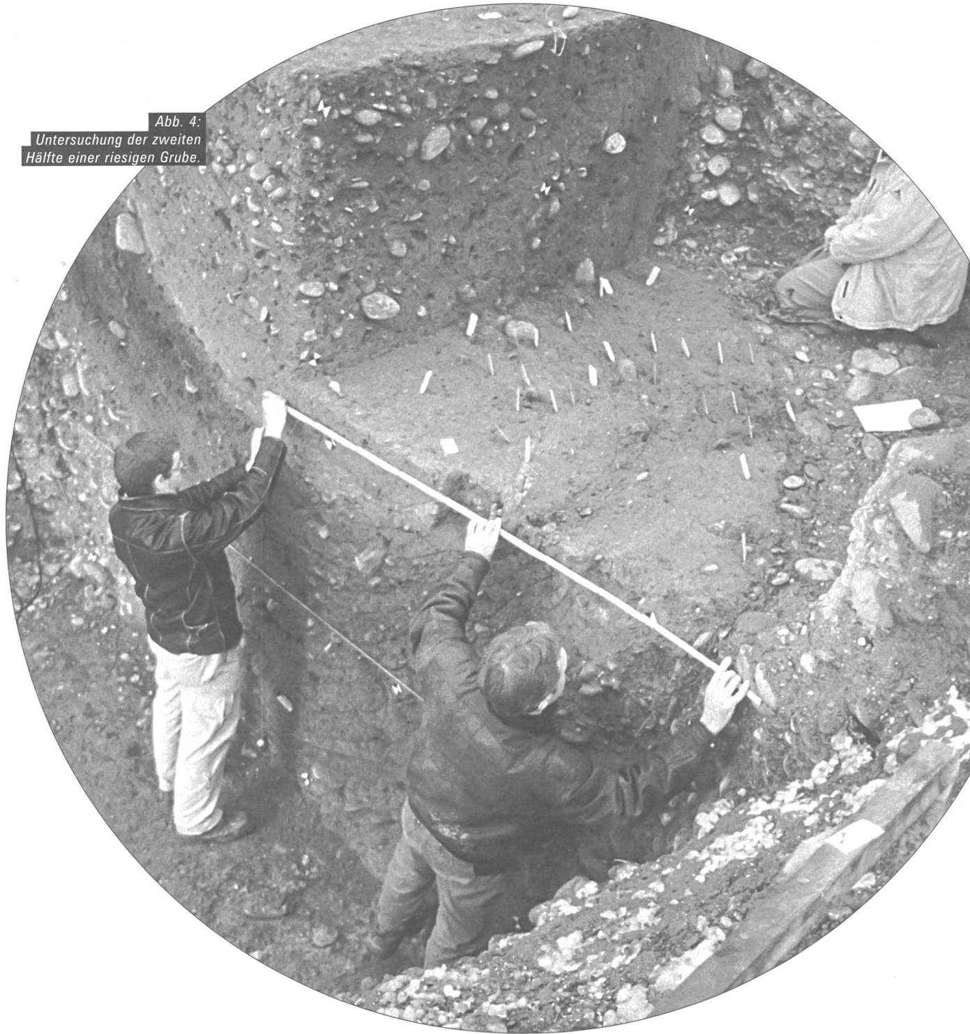
Abb. 4: Untersuchung der zweiten Hälfte einer riesigen Grube.