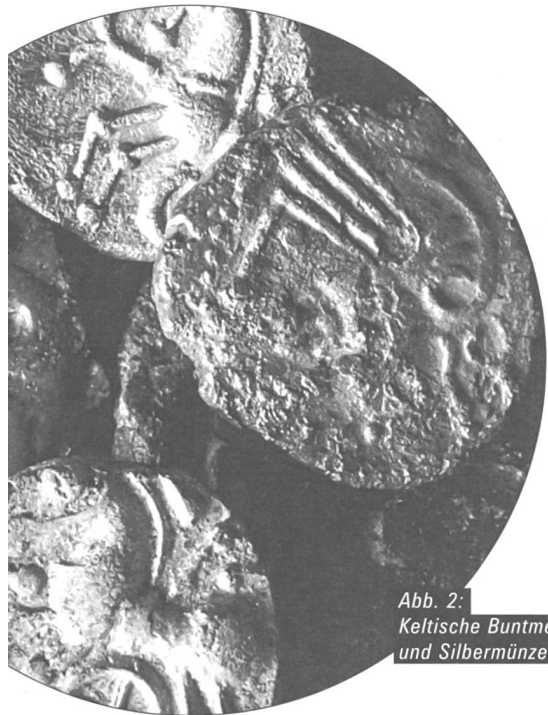
Abb. 2: Keltische Buntmetall- und Silbermünzen.

A ls Hans Kopp im Auftrag des Bieler Sammlers Friedrich Schwab als «Alterthümer-Fischer» unterwegs war und 1857 in La Tène am unteren Ende des Neuenburgersees spektakuläre archäologische Zeugnisse entdeckte, war die latènezeitliche Siedlung in Basel auf dem Gebiet der damaligen Gasfabrik noch unbekannt. Doch anders als bei der Fundstelle in La Tène, wo erst Jahre später eine systematischere Feldforschung einsetzte, führte der Entdecker der Basler Siedlung, Karl Stehlin, nach Bekanntwerden der Fundstelle 1911 noch im selben Jahr wissenschaftliche Grabungen durch, und schon kurz darauf publizierte er erste Ergebnisse.