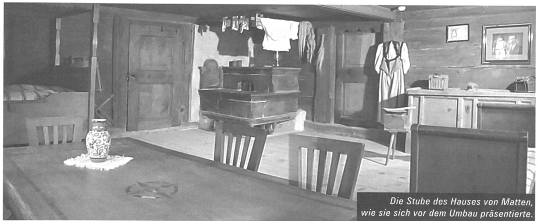
Die Stube des Hauses von Matten, wie sie sich vor dem Umbau präsentierte.

Für die übrigen Einzelhäuser der Musée-Suisse-Gruppe sind neue Lösungen in Evaluation. So wird für das Museum Bärengasse in Zürich und die Schlossdomäne Wildegg AG eine Übertragung auf neue Träger geprüft. Insgesamt soll die Museumsreform für den Bund zu keinen Mehrausgaben führen. pd/NZZ/mif