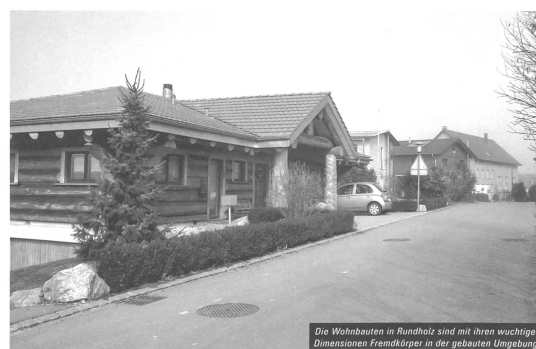
Die Wohnbauten in Rundholz sind mit ihren wuchtigen Dimensionen Fremdkörper in der gebauten Umgebung.

Infos im Internet: www.fondationaubert.ch