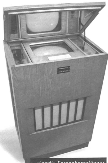
«Landi»-Fernsehempfänger, 1939, Hersteller: Hasler AG.

Anlass zur Schenkung sei der Umstand, dass die heutigen Geschäftsfelder der Ascom nur noch wenig Bezug zu den Wurzeln der Firma aufwiesen, heisst es in der Mitteilung weiter. Die Übergabe und Eingliederung der rund 700 Objekte soll bis im Herbst 2007 abgeschlossen sein. Die Sammlung Ascom wird in die Objektdatenbank des Museums für Kommunikation integriert und auf dessen Website «www.mfk.ch» der Öffentlichkeit zugänglich sein.