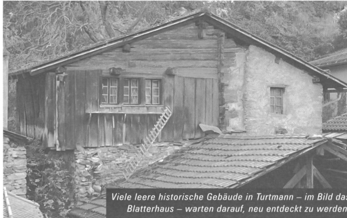
Viele leere historische Gebäude in Turtmann – im Bild das Blatterhaus – warten darauf, neu entdeckt zu werden.

Die Restaurierung soll in enger Zusammenarbeit mit der Kantonalen Denkmalpflege geschehen. Die Stiftung behält sich vor, die Liegenschaft wieder in ihren Besitz zu nehmen, falls es bis Ende 2012 nicht renoviert ist. Die ungewöhnliche Schenkungsidee wurde lanciert, weil die finanziellen Möglichkeiten