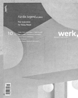
10|07 Für die Jugend et cetera