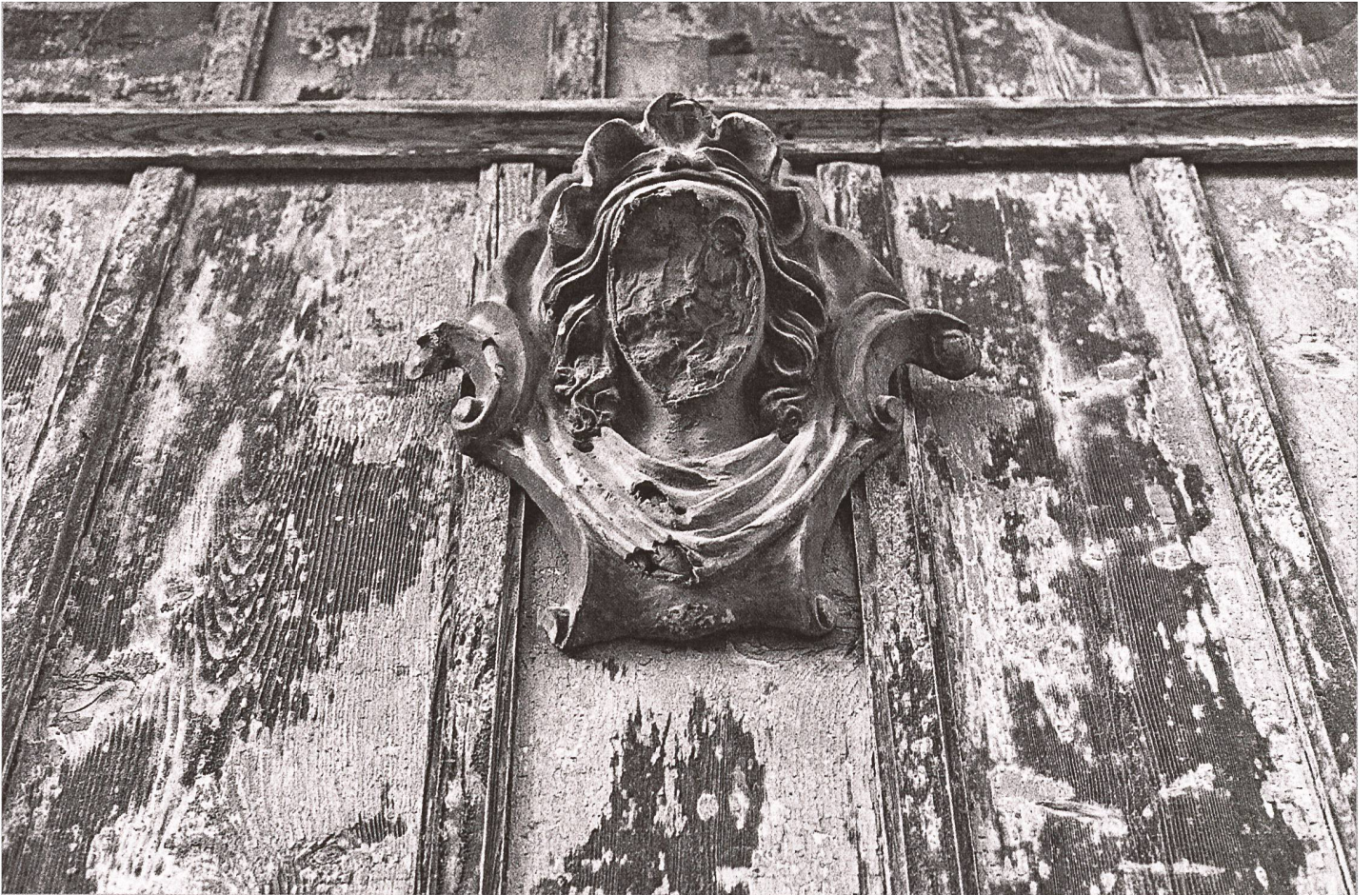
Sandsteinbüste in Neuenburg. ► Detail im Atelier Albert Ankers in Ins.