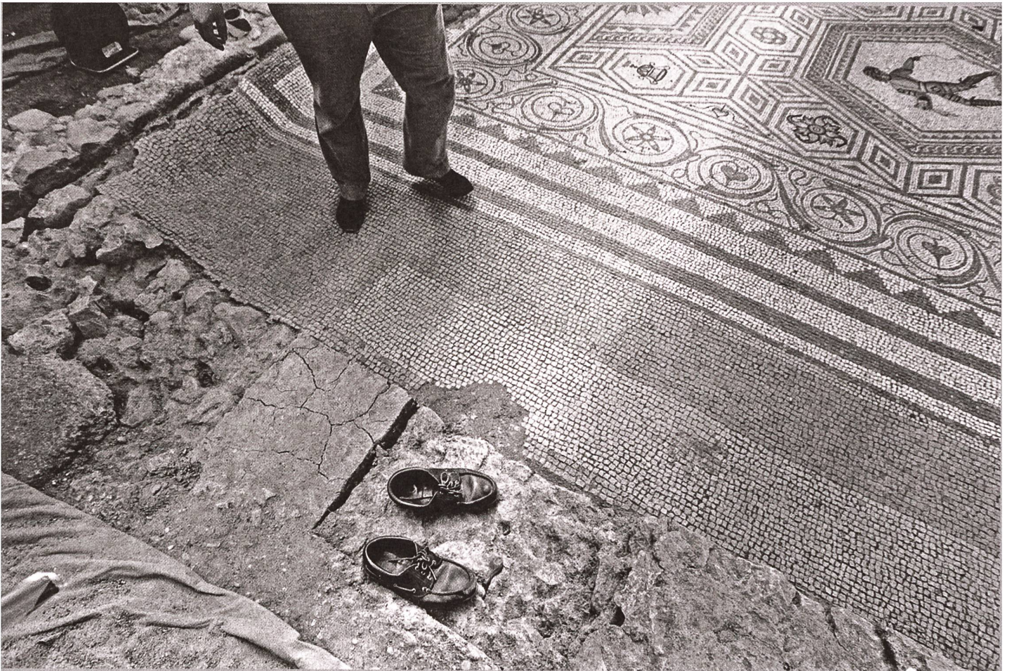
Römisches Mosaik in Vallon.