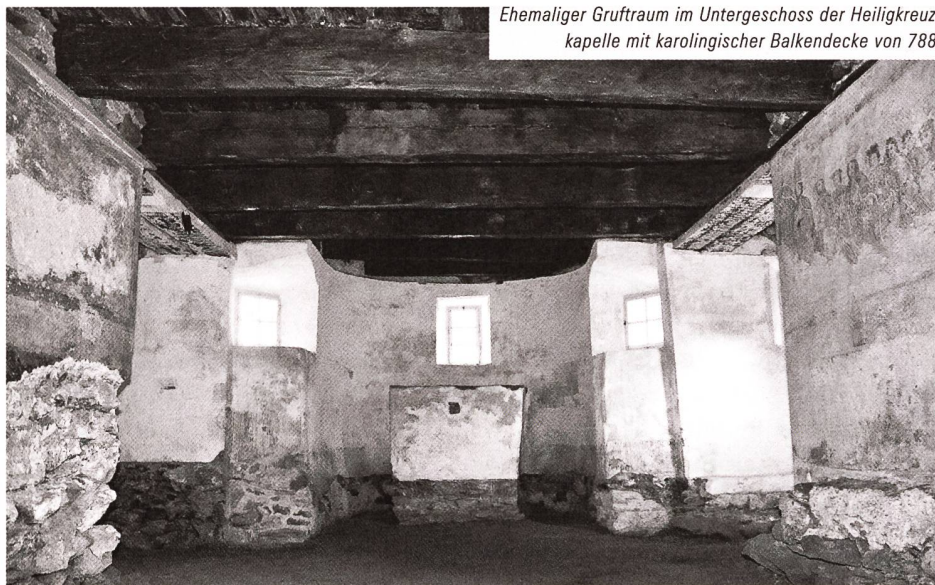
Ehemaliger Gruftraum im Untergeschoss der Heiligkreuzkapelle mit karolingischer Balkendecke von 788.