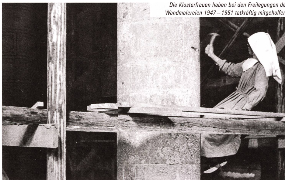
Die Klosterfrauen haben bei den Freilegungen der Wandmalereien 1947–1951 tatkräftig mitgeholfen.