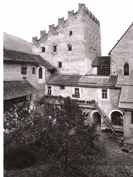
Nordhof mit Plantatum, Zustand 1908 und 2004.

Nach den zentralen Lebensbereichen der Nonnen war die Restaurierung der peripheren Räume geplant. Der Plantatum wurde bewusst ausgeklammert. Er rief sich