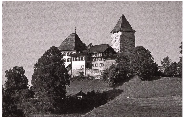
Das Schloss Trachselwald soll nun doch nicht verkauft werden.