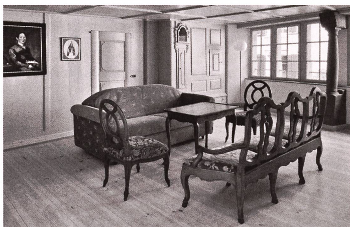
Der Gasthof Hirschen wurde auch wegen seines historischen Mobiliars zum Historischen Hotel des Jahres 2009 gewählt.