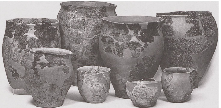
Scherben von Kochgefässen zählen mit zu den häufigsten Funden. Rekonstruierte Keramik aus der Zeit um 3400 v. Chr. aus Siedlungsresten von Nidau und Sutz-Lattrigen am Bielersee.

der Fundstellen vor weiteren Zerstörungen. Dazu ist das UNESCO-Label eine wertvolle Hilfe, denn archäologische Fundstellen wie die Pfahlbauten erhalten nur dann öffentliche Aufmerksamkeit (und damit finanzielle Unterstützung) und Schutz vor anderen Interessen, wenn ihr wissenschaftlicher Wert auf höchster Ebene anerkannt wird. Die Pfahlbauten brauchen engagierte Anwälte, die sich vorbehaltlos für den Schutz des fragilen archäologischen Erbes unter Wasser und in Feuchtgebieten einsetzen.