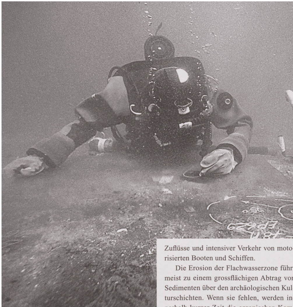
Taucher der Tauchequipe des Archäologischen Dienstes Bern beim Dokumentieren von prähistorischen Pfahlbau-Siedlungsresten unter Wasser.

Zuflüsse und intensiver Verkehr von motorisierten Booten und Schiffen.