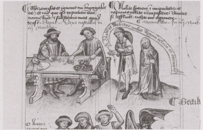
Kapitelillustration zu «Geiz» aus Hugo von Trimberg: Der Renner – «Tafel der christlichen Weisheit». Nürnberg, 1425–1431 / zwischen 1439 und 1444 (Cod. Pal. germ. 471).

Das Projekt wurde im Digitalisierungszentrum der Universitätsbibliothek Heidelberg durchgeführt. Dort wird an zwei mit hochauflösenden Digitalkameras ausgestatteten Kameratischen «Grazer Modell» gearbeitet. Dieser speziell zur Digitalisierung von Handschriften entwickelte Kameratisch ermöglicht eine