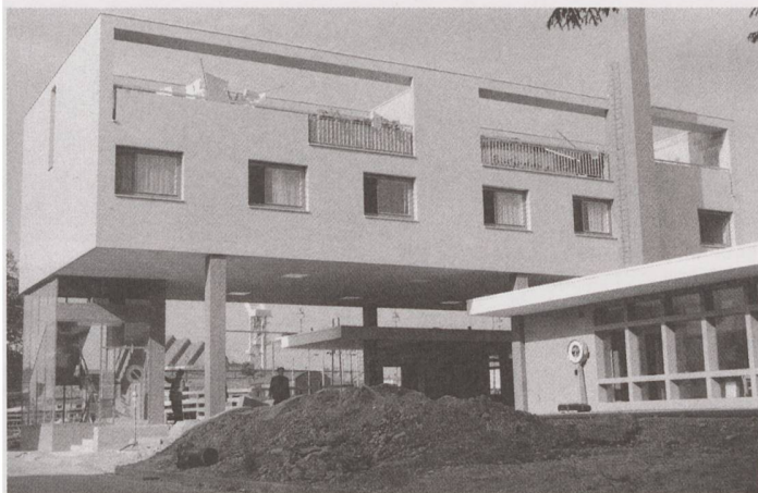
Neuer Typus: Eines der frühesten Stationsgebäude mit Wohntrakt von Max Vogt.