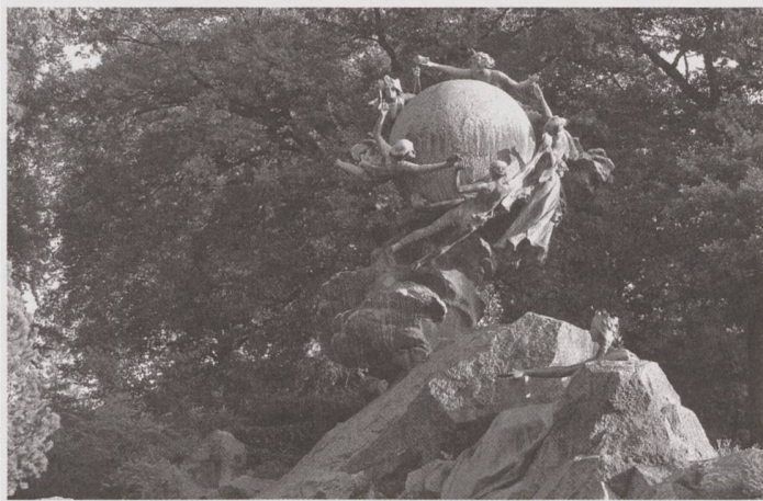
Le monument de l'UPU à Berne a inspiré l'emblème de l'organisation.