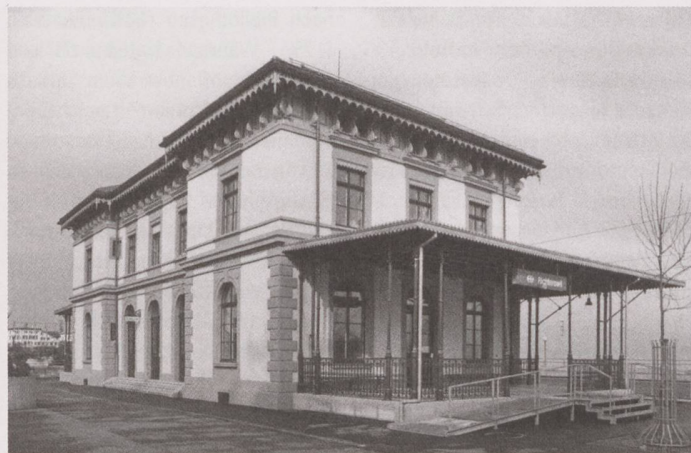
Die Sommerwärtssäle am Bahnhof Richterswil sind eine Rarität.

Unter den verzeichneten Objekten befindet sich mit dem 1847 errichteten Stationsgebäude in Dietikon, einem Überrest der «Spanisch-Brötli-Bahn», der älteste noch erhaltene Bahnhof der Schweiz – auch wenn der Bau schon von über 140 Jahren um 350 Meter versetzt und umgenutzt wurde. Eine Rarität ist das 1876 von Heinrich Gmelin erbaute Stationsgebäude in Richterswil, vor allem im Hinblick auf seinen originalen Erhaltungszustand. Der Gründerzeit-Bau besitzt sogar noch die beiden «Sommerwärtssäle», gedeckte Terrassen, die seitlich an den Hauptbau anschliessen.