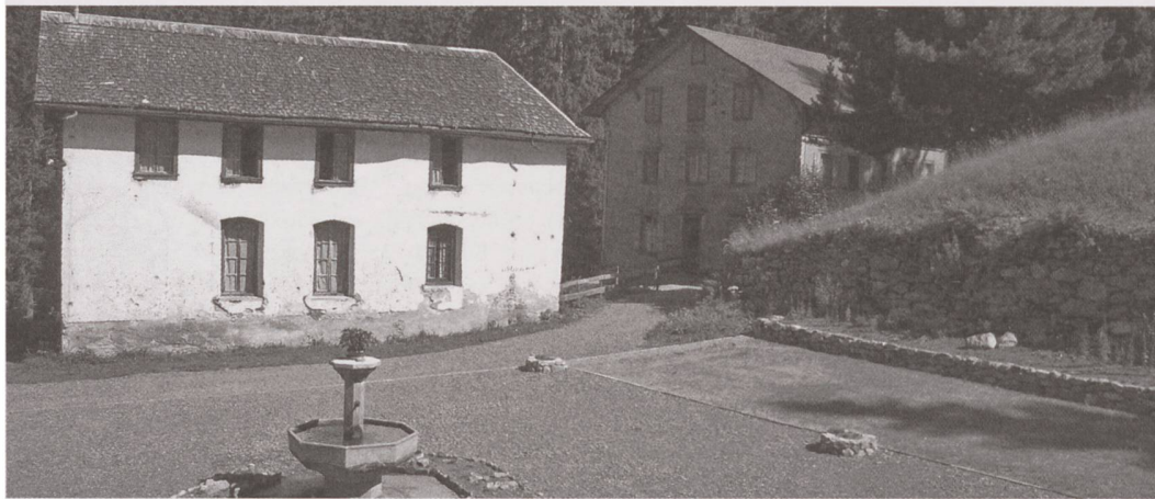
Der zentrale Hofplatz der Hotelanlage, rechts der Standort des ehemaligen Teehauses.