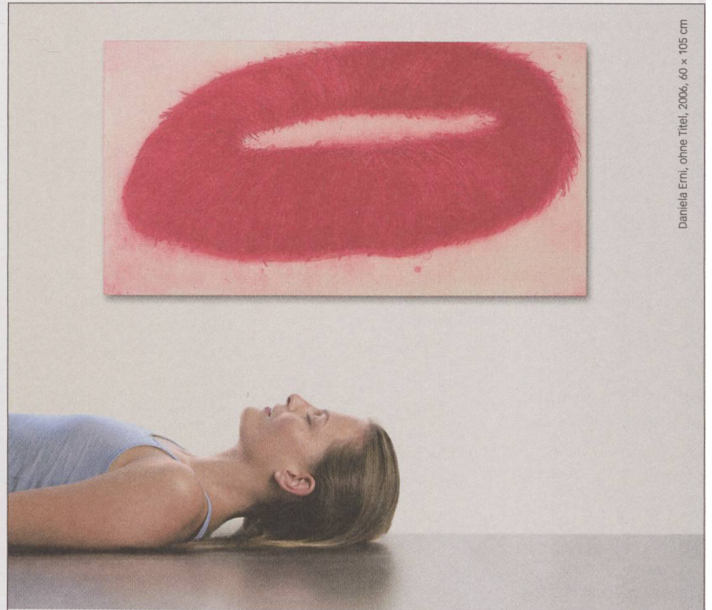
Daniela Erm, ohne Titel, 2006, 60 x 105 cm

vestigia memoriae tradere info@vestigia.ch . www.vestigia.ch