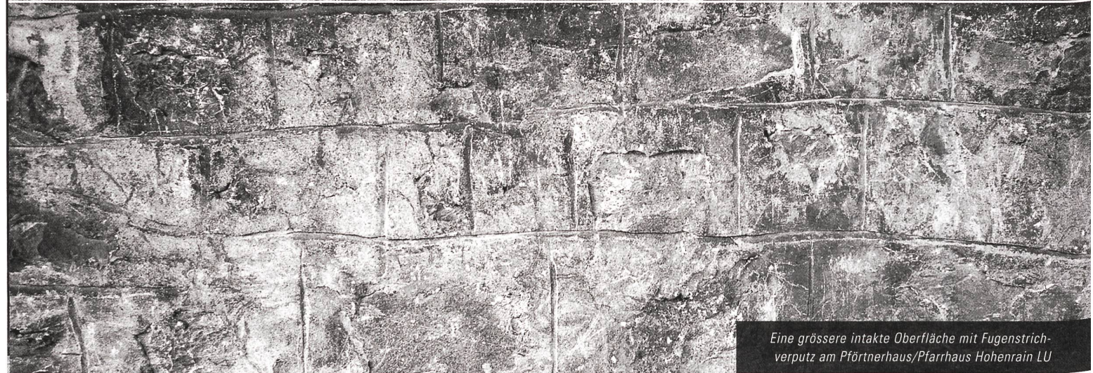
Eine grössere intakte Oberfläche mit Fugenstrichverputz am Pförtnerhaus/Pfarrhaus Hohenrain LU