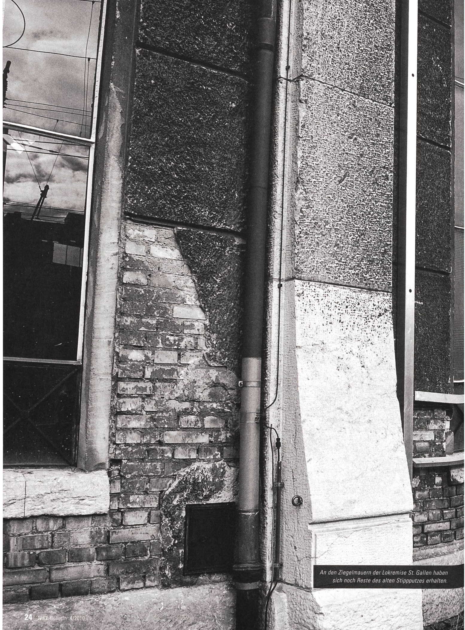
An den Ziegelmauern der Lokremise St. Gallen haben sich noch Reste des alten Stippputzes erhalten.