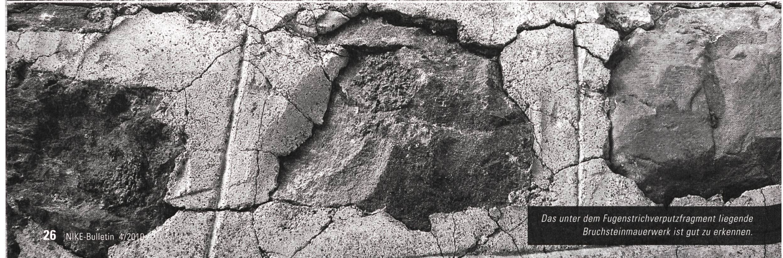
Das unter dem Fugenstrichverputzfragment liegende Bruchsteinmauerwerk ist gut zu erkennen.