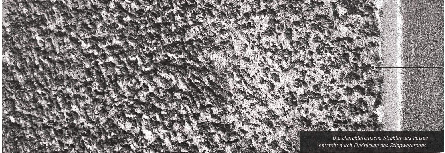
Die charakteristische Struktur des Putzes entsteht durch Eindrücken des Stippwerkzeugs.