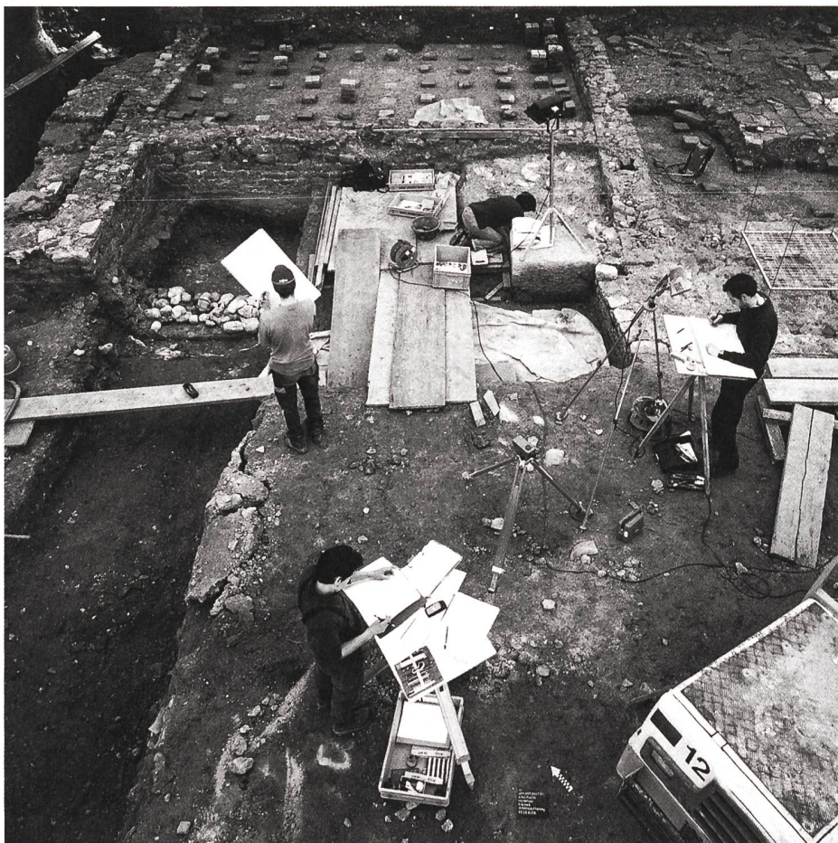
Vestiges d'une ferme domaniale de l'époque romaine à Kallnach (BE).

terrain ou encore un impôt réservé pour la protection du patrimoine). Elles ont le malheur d'exiger des actions politiques (changements de lois au niveau cantonal et fédéral) longues et sinueuses, et sont de ce fait rapidement abandonnées par les instances gestionnaires. Seule reste donc comme action réaliste et réalisable de convaincre de l'extrême importance du patrimoine archéologique auprès des bailleurs de fonds uniques que sont les instances politiques cantonales et fédérales. La manne financière passe actuellement uniquement par un travail de lobbying intense et continu, accompagné d'actions locales, régionales et nationales, d'où l'importance de la diffusion des résultats des travaux accomplis et la sensibilisation de la population.