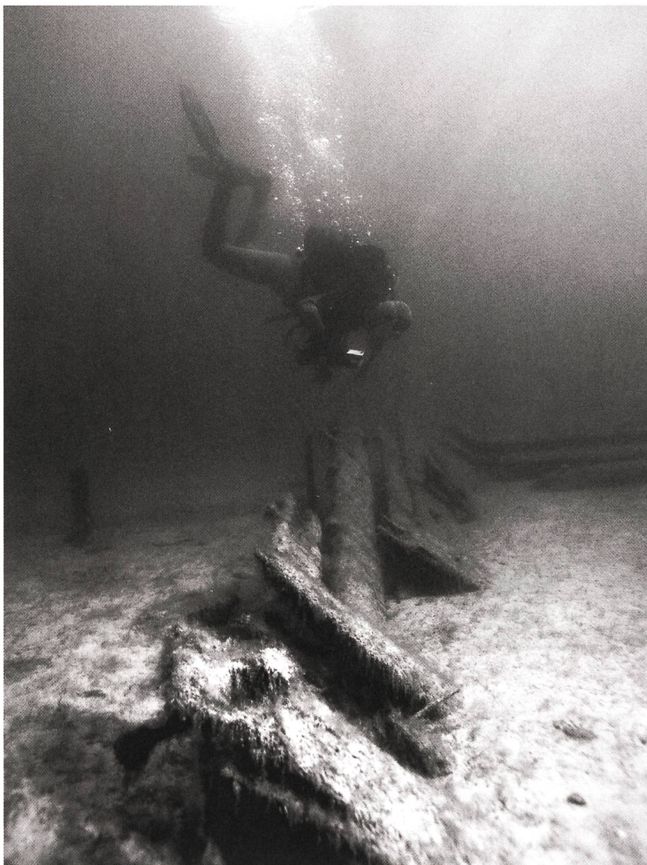
Un archéologue subaquatique examine l'épave d'un bateau coulé.

La création des services cantonaux a été accompagnée par la mise en place de législations cantonales, actuellement soumises à des révisions parfois importantes. Ces lois imposent en général l'obligation d'exécuter des fouilles dans le cas où la conservation d'un site archéologique est mise en danger. Elles impliquent donc la mise sur pied d'infrastructures permettant d'encadrer et de financer la réalisation des fouilles, la conservation du matériel découvert, la documentation des données exploitables et leur archivage.