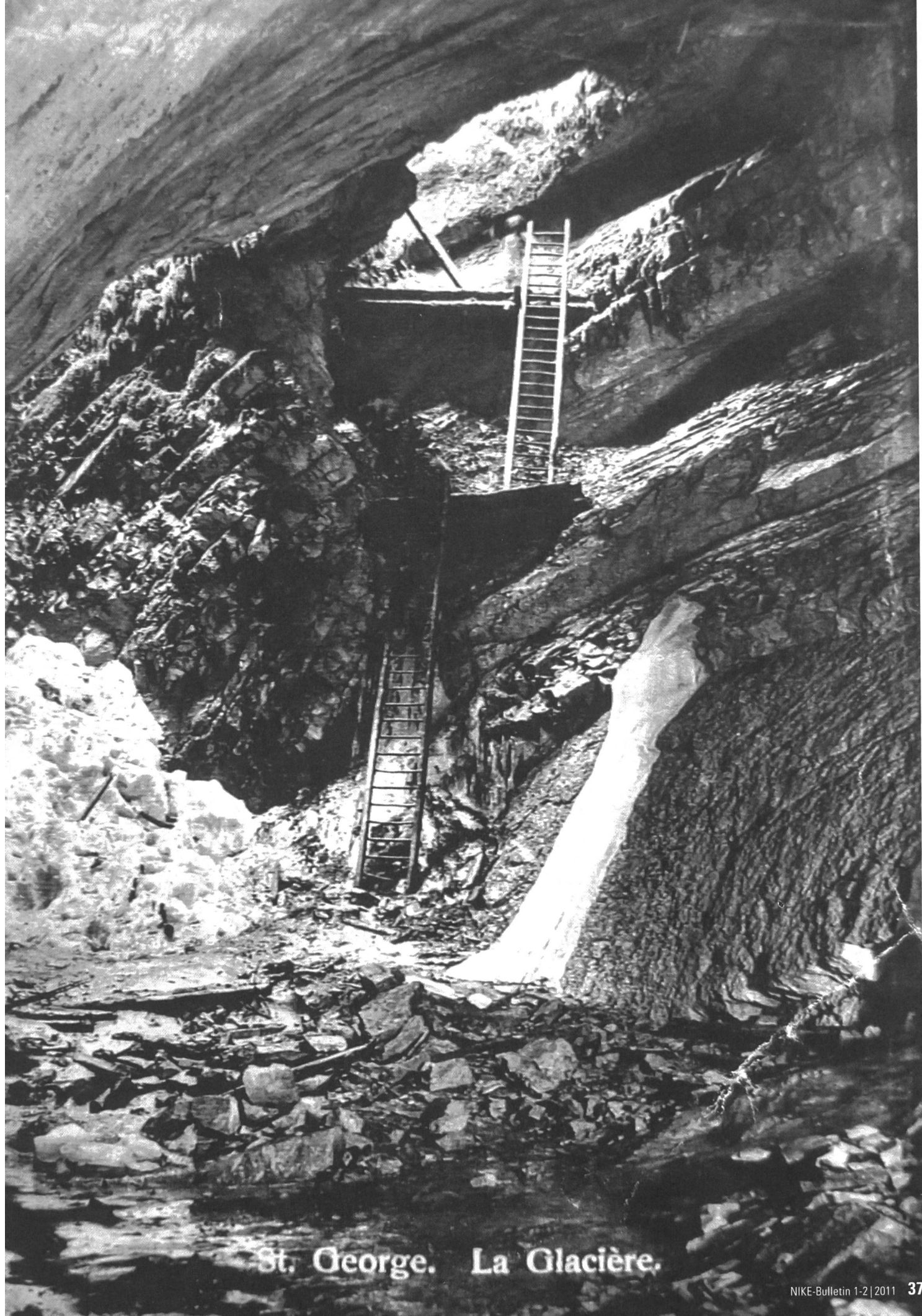
St. George. La Glacière.