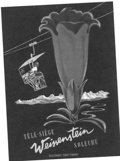
Werbeplakat aus den Anfängen des Weissenstein-Sessellifts.

Der Schweizer Heimatschutz kämpft seit einem halben Jahrzehnt um den Erhalt des Sessellifts am Solothurner Hausberg, dem Weissenstein. Die einzigartige Anlage begeistert nicht nur Technikinteressierte sondern steht sinnbildlich für einen nachhaltigen Tourismus in einer geschützten Landschaft.