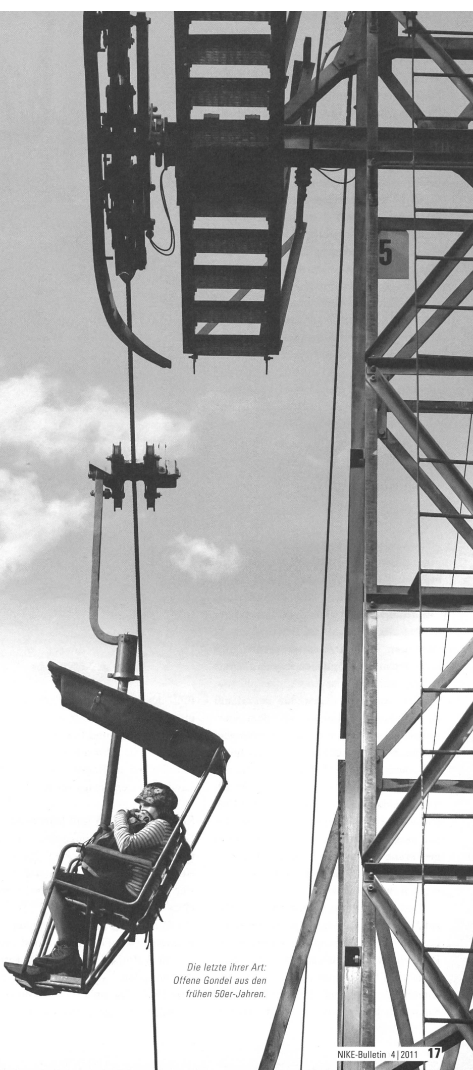
Die letzte ihrer Art: Offene Gondel aus den frühen 50er-Jahren.

Der Schweizer Heimatschutz setzt sich seit über einem halben Jahrzehnt für den Erhalt von bedeutenden Sessel- und Skiliften ein, die immer mehr vom Aussterben bedroht sind. Begonnen hatte das Engagement mit einer Studie des Historikers Tobias Wildi, die auf das Verschwinden dieser «Denkmäler in der Wildnis» hinwies. Es folgten zahlreiche Medienmitteilungen, Artikel und schliesslich 2007 ein Ausflugsplaner zu den «Schönsten Verkehrsmitteln der Schweiz». Der Höhepunkt der Sensibilisierungskampagne bildete der Schoggitaler 2010, dessen Frontseite dem historischen Sessellift Weissenstein gewidmet war und von Schulkindern aus der ganzen Schweiz in einer Auflage von rund 600 000 Stück verkauft wurde.