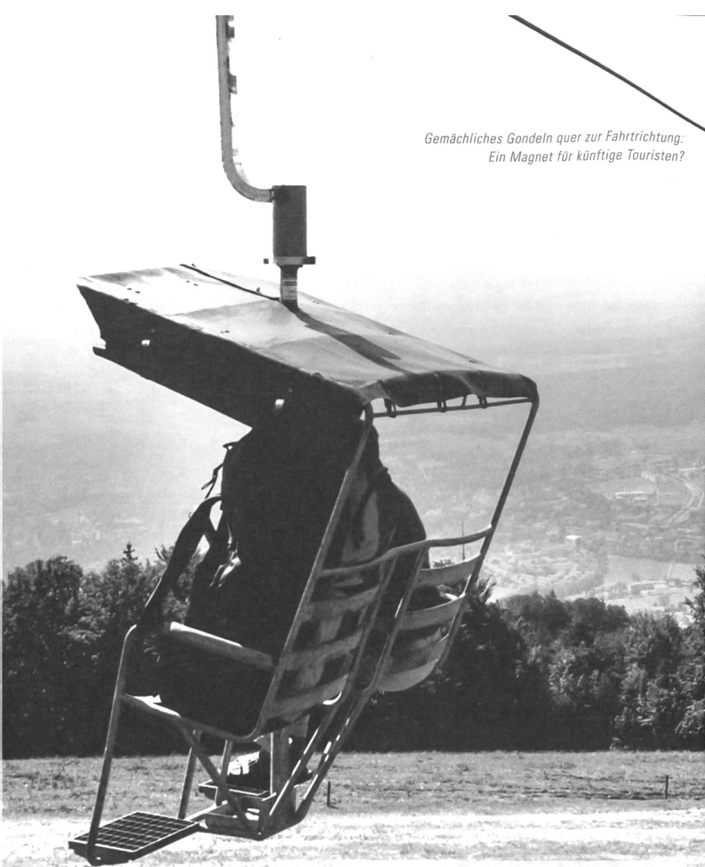
Gemächliches Gondeln quer zur Fahrtrichtung: Ein Magnet für künftige Touristen?

Das gemächliche Gondeln in den quer zur Fahrtrichtung stehenden Zweiersesseln war bis zur Stilllegung der Weissenstein-Bahn ein Erlebnis, das zum Naherholungsgebiet am Jurasüdfuss passte und bereits auf der Fahrt Ruhe und Entspannung in einer immer hektischeren Zeit bot. Das Ge-