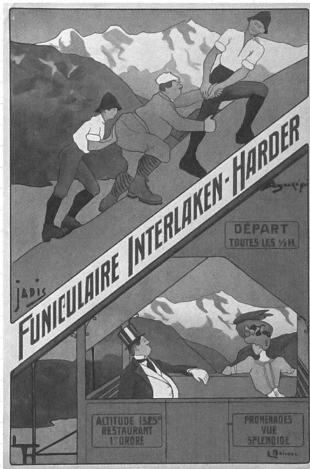
Ernest Jacques Boiceau: Funiculaire Interlaken-Harder, ca. 1910.

Tourismusplakate, die Seilbahnen als Motiv aufnehmen, illustrieren nicht nur exemplarisch die Geschichte des Schweizer Tourismusplakats, an der einige der bedeutendsten Plakatgestalter beteiligt waren. Darüber hinaus berichten sie auch von der Entwicklung des Tourismus, der zu Beginn des 19. Jahrhunderts noch völlig anders ausgerichtet war als heute. Frühe Tourismusplakate aus den 1910er-Jahren zeigen meist detailreiche, grosszügige Panoramadarstellungen, ergänzt von Fahrplänen. Spezifische Gesetze des Mediums wie Fernwirkung durch formale und farbliche Reduktion wurden noch weitgehend missachtet: Fahrpläne wollen nahsichtig gelesen werden, sie sind vor allem Information. Auch Fahrzeiten für Seilbahnen wurden in Plakatform kommuniziert, Seilbahnen sind darauf kaum zu erkennen.