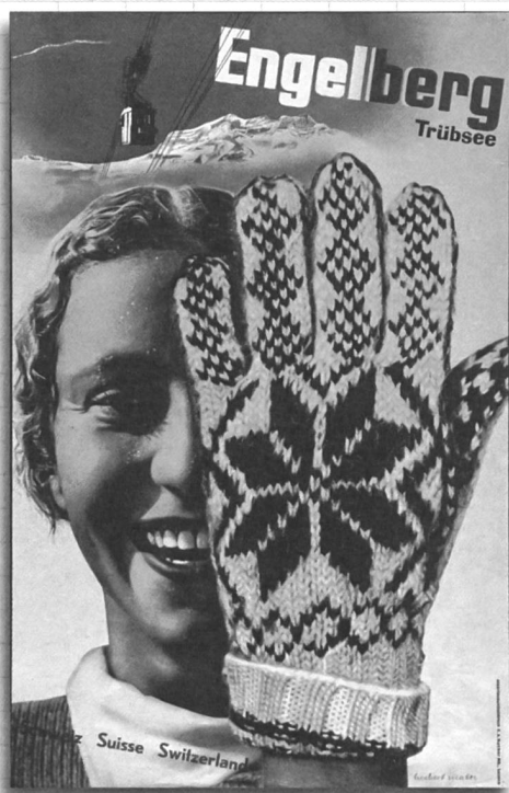
Herbert Matter: Engelberg – Trübsee, 1935.