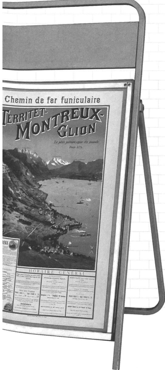
Johannes Weber: Chemin de fer funiculaire – Territet-Montreux-Glion, 1912.