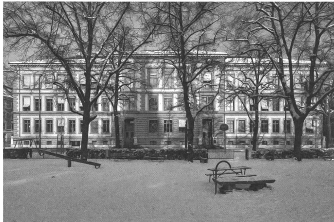
Frontalansicht des 1882–1883 vom Basler Kantonsbaumeister Heinrich Reese erbauten Bläsischulhauses. Das Schulhaus befindet sich im Kleinbasel in der Denkmalschutz-Schutzzone.

Der neue, rollstuhlgängige Lift ist verglast und sehr schlank ausgebaut; er führt vom Niveau des Trottoirs in alle Etagen des Gebäudes.