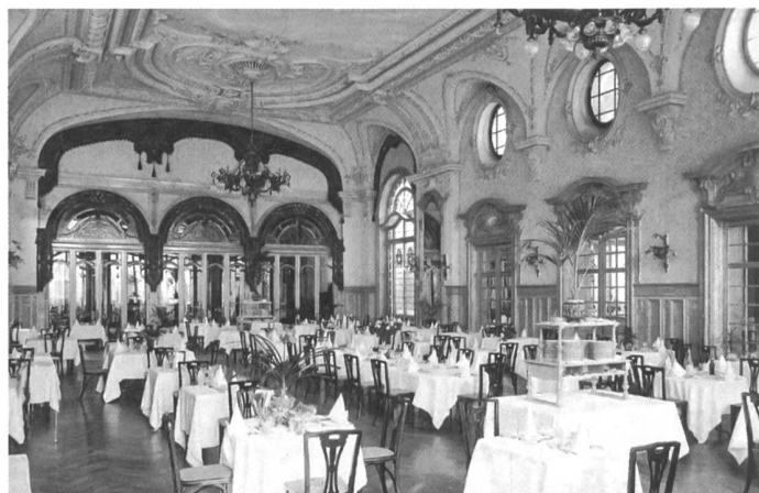
Les discussions dans les salles à manger des palaces étaient codifiées ainsi que la disposition des convives, les plus connus et les plus généreux d'entre eux étaient placés au centre.

Elaborée en cinq volets thématiques – Manger à la maison, Manger en plein air, Manger au restaurant, Manger en public et Manger comme il faut – l'exposition raconte un repas caméléon, dont les rituels, le décorum et les règles varient en fonction des messages que les convives veulent faire passer. Réceptacle des valeurs familiales, de ses règles comme de ses dérègle-