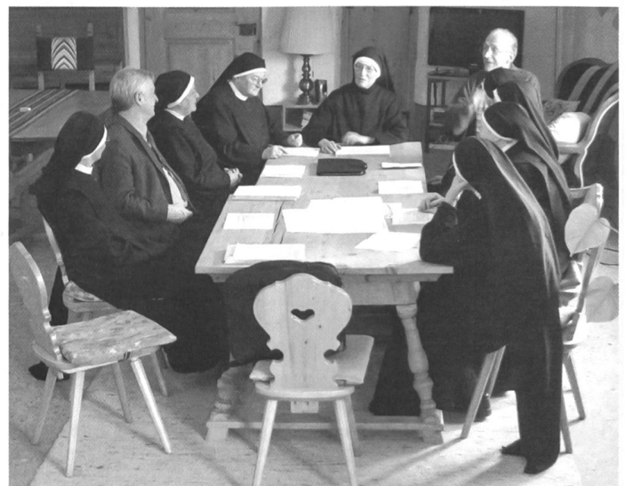
Ein regelmässiger Dialog ist Voraussetzung für ein verständnisvolles Nebeneinander von Konvent und Unesco-Welterbe.

stanz über die Zeit zu retten. Einige Pflegekonzepte musste die Bauhütte zusammen mit Fachleuten selber entwickeln und ausprobieren (unter anderem Leinölanstriche, Schlämmen, Verputz- und Mörtelbodenrezepte). Über die Massnahmen wird Buch geführt, damit man aus Vor- und Nachteilen lernen kann. So wird der Schreiner zum Restaurator und Holzpflegfachmann oder der Maurer zum Verputz doktor mit einzigartigen Spezialkenntnissen. Selbstverständlich brauchen solche Programme ein funktionierendes backoffice , bei uns Bauhütte genannt, welches auch für die Archivierung der Bauakten, die Fotodokumentation und die Plan-nachführung verantwortlich zeichnet.