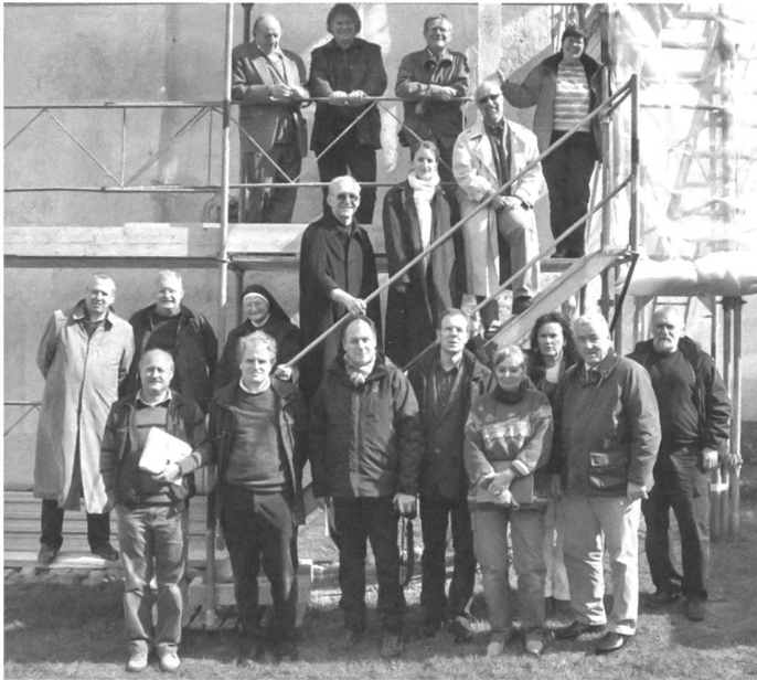
Periodische wissenschaftliche Kolloquien sind entscheidend für die Festlegung der Vorgehensweisen bei komplexen Restaurierungsprojekten wie der Heiligkreuzkapelle.

sich daraus ein think tank , der eine unité de doctrine und daraus mit der Zeit eine best practice entwickelte. Diese Schlagworte sind zwar in aller Munde, müssen aber in einer vertrauensvollen Umgebung mit einer sensiblen kommunikativen Führung umgesetzt werden. In die Gruppe werden alle integriert, die längerfristig an einem Projekt im Kloster mitarbeiten, seien sie Vollzeit oder Teilzeit angestellt, eingemietet oder freie Mitarbeiter. Schreiner und Maurer pflegen den gleichen schonenden Umgang mit der Bausubstanz. Sie wissen, wann sie den Bauforscher zur Dokumentation beziehen müssen. Der Bauforscher erkennt Bau-