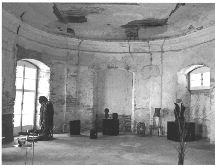
Pfaffnau, Kloster St. Urban, Orangerie, Innenansicht.

vertrag ab. 1780 war das Gebäude fertig gestellt.