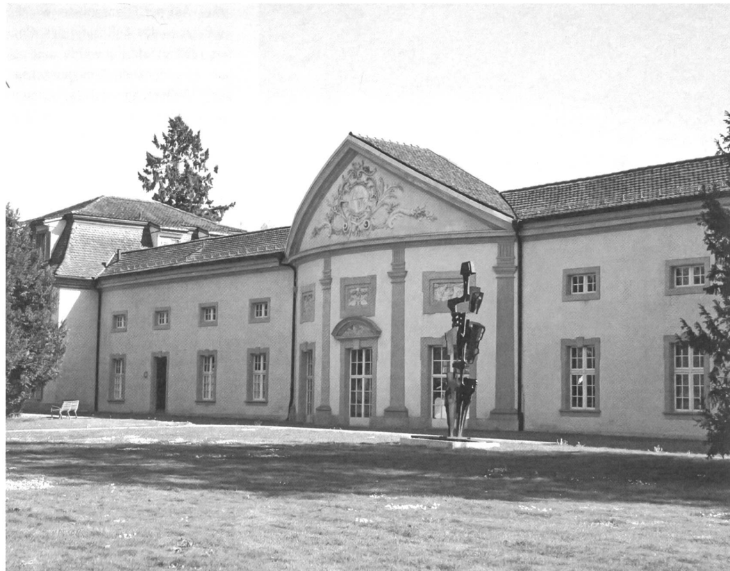
Pfaffnau, Kloster St. Urban, Orangerie, Ansicht von Nordwesten.

Während sich die europäischen Herrschaftshäuser in Sammlungsgrösse und Prachtentfaltung der Orangerien zu überbieten suchten, sah die Situation in der Schweiz etwas anders aus. Auch hierzulande wurden bereits im 15. Jahrhundert einzelne Früchte beispielsweise via die Alpentäler in Graubünden aus Italien importiert. Jedoch erst im 17., mit Bestimmtheit aber im 18. Jahrhundert wurden erste Orangerien gebaut. Durch die Einflüsse der Nachbarländer Frankreich, Deutschland und Italien gibt es keine spezifisch schweizerische Orangerie-Kultur. Die vielfach in fremden Kriegsdiensten stehenden Schweizer Edelleute brachten Ideen, Eindrücke und wohl nicht selten auch gleich ganze Pflanzen aus ihren Soldgebieten mit. Eine Eigenheit der Schweizer Orangerienlandschaft ist ihre Kleinteiligkeit. So können bereits innerhalb von Kantonsgebieten erhebliche Unterschiede in der architektonischen Ausgestaltung der Orangerien beobachtet werden. Das meist beschränkte Platzangebot erforderte unkonventionelle Lösun-