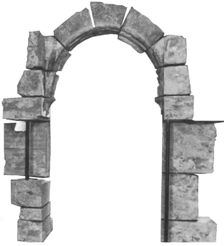
Bern, Historisches Museum Bern, Ausstellung «Bilderstrum, Wahnsinn oder Gottes Wille?» 2000.

nahme von Portalen oder Arkadenreihen als pittoreske Staffage geeignet schienen, boten sich die damals neu entstehenden Museen und kulturhistorischen Sammlungen an. Museal ausgestellt sollten die steinernen Geschichtszeugnisse sowohl eine Vorstellung von der Baukunst vergangener Zeiten vermitteln als auch als Lehrmaterial für Künstler und Handwerker dienen. Die praktische Umsetzung solcher Ideen erwies sich allerdings als problematisch. In Konkurrenz zu anderen Kunstwerken konnten die häufig mit seriell wirkenden Ornamentformen dekorierten Baufragmente nicht bestehen. Eine Entwicklungsreihe von Kapitell- oder Fensterformen liess sich zudem durch Gipsabgüsse oder in Gestalt von Abbildungen in einem Buch sehr viel einfacher vor Augen führen. Man griff deshalb auch im Museum zumeist auf die Idee einer Wiederverwendung einzelner Bauteile zurück und setzte auf die Schaffung von mehr oder weniger wirklichkeitsnahen Erlebnisräumen. Im als Kreuzgang bezeichneten Saal des Zürcher Landesmuseums stammen die Maßwerkfenster aus dem Barfüsserkloster, die Arkadenreihe der gegenüberliegenden Wand aus dem ehemaligen Dominikanerkloster (beide in Zürich). Obwohl Überarbeitungen dazu führten, dass die historischen Teile im geschlossenen Erscheinungsbild des Raumes verschwinden, betonte Museumsdirektor Heinrich Angst deren Bedeutung im Bestreben «ein möglichst getreues und namentlich für das grosse Publikum verständliches Bild vergangener Zeiten zu geben».