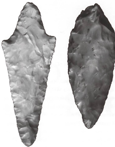
Links: Silexdolch aus Egolzwil (Herkunft Norditalien), Rechts: Silexdolch aus Wauwil (Herkunft Bayern).

Immer wieder werden in jungsteinzeitlichen Dörfern der Schweiz aber auch Artefakte aus Silex entdeckt, die nicht aus den nächsten Aufschlüssen stammen, sondern einen langen Weg hinter sich haben. Eine seriöse Zuweisung von Silexarten kann nur durch eine petrographische Analyse unter dem Mikroskop erfolgen. 4