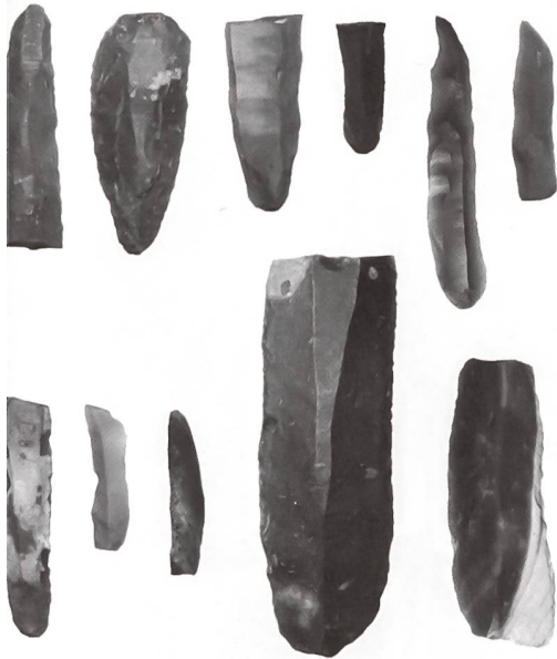
Importierte Silexobjekte, welche im Kanton Luzern entdeckt wurden. Herkunft: Frankreich, Mittelitalien, Holland.

Stücke sind jedenfalls nicht erkennbar. Aus der Ethnologie wissen wir, dass dem Tausch häufig komplizierte Systeme und Gedankenwelten zugrunde liegen; diese sind archäologisch natürlich nicht fassbar.