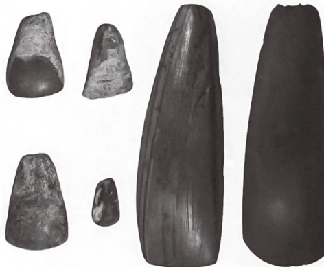
Importierte Steinbeile aus Egolzwil. Links: Herkunft Piemont (Jadeit), Rechts: Herkunft Vogesen (Aphanit).

Steinmaterialien für die Herstellung von Geräten und Schmuck wie auch fertige Objekte waren in der Jungsteinzeit gefragte Handelswaren. Bemerkenswert ist die Tatsache, dass gewisse Objekte über