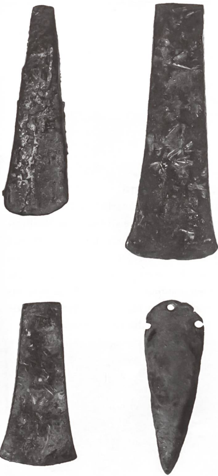
Kupferfunde aus dem Kanton Luzern.