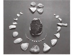
Flechttasche mit Schnecken aus dem Mittelmeer.

Der Beginn der bäuerlichen Lebensweise um 5500 v. Chr., die so genannte Neolithisierung, ist ohne Handel und Fernkontakte gar nicht denkbar. Die wichtigsten Grundlagen, Haustiere und Kulturpflanzen, wurden nämlich alle eingeführt und ermöglichten den Jägern und Sammlern die Umstellung auf die neue Ökonomie.