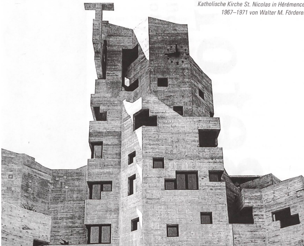
Katholische Kirche St. Nicolas in Hérémence, 1967–1971 von Walter M. Förderer.