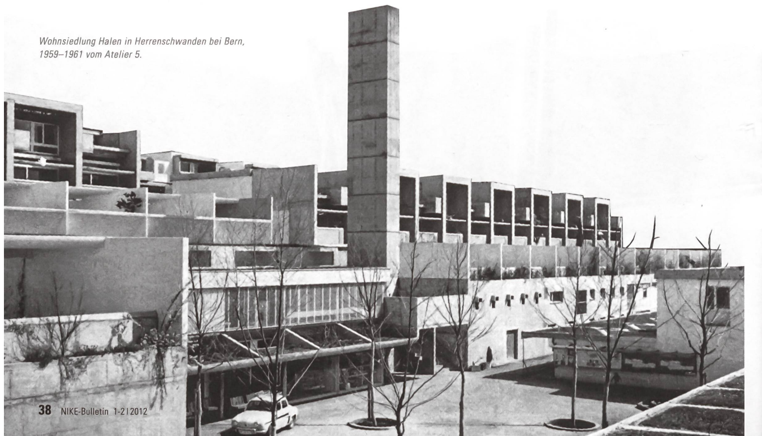
Wohnsiedlung Halen in Herrenschwanden bei Bern, 1959–1961 vom Atelier 5.