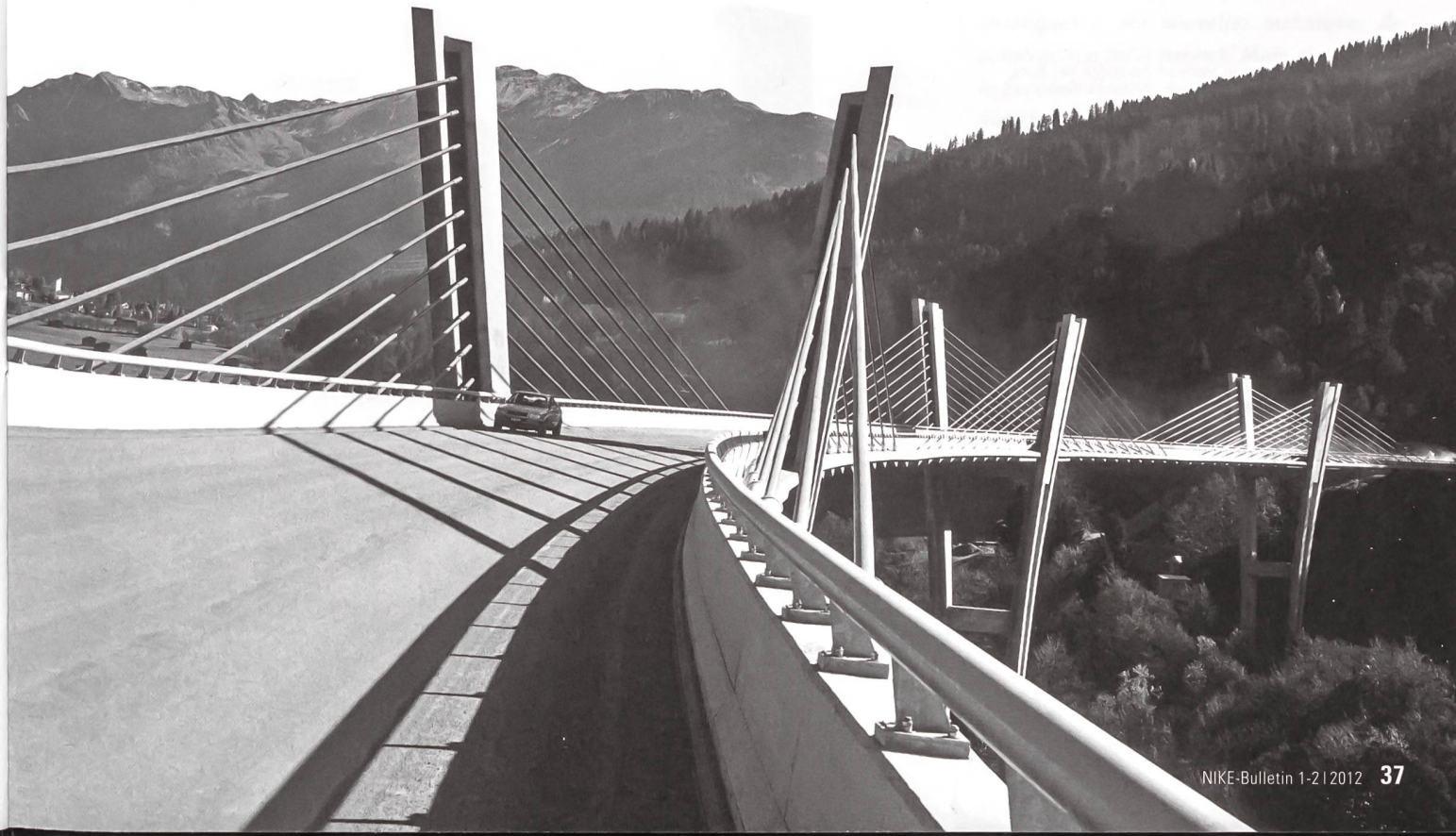
Sunnibergbrücke in Klosters-Serneus, 1996–1999 von Christian Menn.