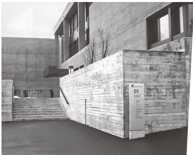
Bei der Universität St. Gallen erfolgte die Betonsanierung nach dem Grundsatz «So wenig wie notwendig».

welche Risse verursachten. Die Baumeister hatten Stampfbeton als Ortbeton genutzt. Er war sehr porös, Mischung und Siebkurven waren höchst unterschiedlich. Die Tonhohlkörper des Ziegelkerns störten den Vorgang des Betonierens, Vibratoren fehlten bei der Applikation des Betons gänzlich, sie waren damals in der Schweiz noch unbekannt. Kiesnester bildeten sich aus. Bei den Schalbretterstössen drang Wasser in die Fassadenwände ein. Die Armierungseisen waren teilweise ungenügend überdeckt. In der Folge rosteten sie, da und dort platzte der Beton ab. Die Beton-Querstäbe der Fenster begannen abzusanden. Die zunehmende Luftverschmutzung verschlimmerte die Situation. Salze und Kohlendioxid drangen aus der Luft und bei jedem Regenschlag in die Betonschalen ein. Die Karbonatisierung der Oberflächen verstärkte sich. Der pH-Wert sank von 12,5 unter 9 – der Beton wurde weich, verlor seine Festigkeit und die Fenster drohten aus den Fassaden zu stürzen. Bereits 1950 musste der Glockenturm mit Spritzbeton gesichert werden. 1962 wurden Risse im Kirchenschiff ausgebessert. 1973 folgte die Sanierung des Turms und der gealterten Eingriffe aus den Jahren 1950 und 1962.