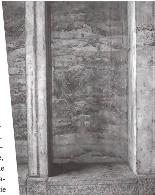
Der Originalbeton der Antoniuskirche zeigt grossflächig Kiesnester und offene Stellen.

Seit 1975 überwiegt die Zahl von Werbeanzeigen für Betonsanierungen deutlich jene der Praxisberichte. Viele Sichtbetonbauten wurden in den letzten 30 Jahren saniert. Viele fehlen in den Bauinventaren, da sie nicht zu den Ikonen der Moderne und den denkmalschützerisch bedeutenden Solitärebauten gehören. Dazu zählen Bauzeugen des Woh-