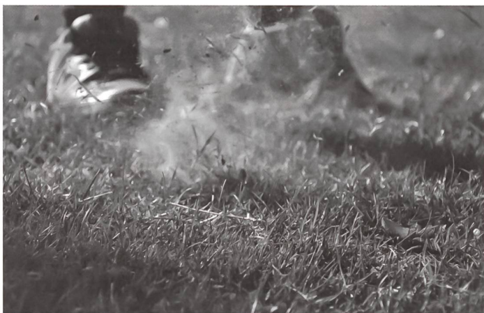
Das Siegerbild von Joël Wirz.

Internationaler Fotowettbewerb für Kinder und Jugendliche bis 21 Jahre + + + seit 1996 jährlich durchgeführt + + + Über 20 000 Teilnehmende weltweit Concours de photos international pour enfants et jeunes adultes jusqu'à 21 ans + + + depuis 1996 chaque année + + + plus de 20 000 participants et participantes dans le monde entier