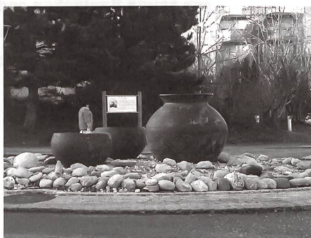
Fig. 4: Giratoire à Bulle (FR) présentant une interprétation de trois céramiques trouvées dans un tumulus du Bronze final avant la construction du lotissement Pré Vert visible à l'arrière-plan.