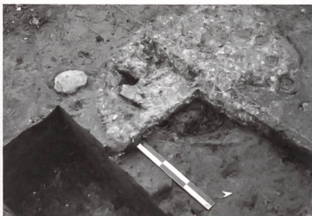
Fig. 1: Foyer de forge d'époque romaine mise au jour à Chevenez (JU) en mai 2012 sur le site de construction de l'unité de production TAGHeuer.

L'archéologie cantonale jurassienne est une jeune organisation qui compte trois collaborateurs «fixes», à temps partiel, et bénéficie d'un budget de fonctionnement modeste. En mai de cette année, elle a été confrontée à la découverte d'un site archéologique inconnu sur le chantier d'une usine horlogère à Chevenez, importante construction pour l'économie jurassienne qui s'étend sur une surface d'environ 2500 m 2 (fig.1). La découverte relève du hasard, due à un promeneur averti et non à des sondages préalables du service archéologique. Une fouille d'urgence a cependant pu être organisée, du personnel temporaire engagé, et les vestiges furent tous documentés, même si cela ne put pas toujours se faire