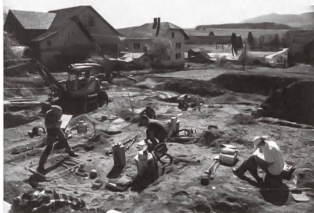
Fig. 3: Fouille de sauvetage de la nécropole de Chavannes-sous-Orsonnens (FR) en mai 2012: Grâce à la collaboration exemplaire du machiniste travaillant à la construction d'une villa, le Service archéologique est intervenu sur le chantier et a pu mettre au jour une trentaine de squelettes.