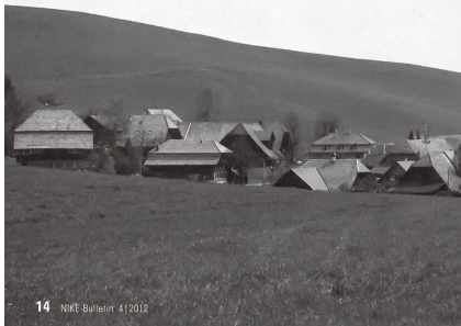
Strassenbau und Lärmschutz verändern Ortsbilder oft stark.