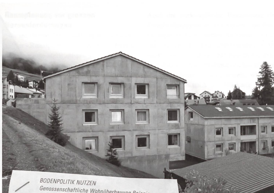
BODENPOLITIK NUTZEN Genossenschaftliche Wohnüberbauung Reisgia in Sainas, Ftan GR, 2010.

13 Wohnungen in zwei Neubauten bilden einen dichten Ort – ein Gegenprojekt zu den üblichen, landzersiedelnden Einfamilienhäusern (Wettbewerb, Parzelle der Gemeinde im Baurecht inkl. günstiges Darlehen).