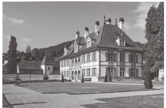
Ansicht von Schloss Oberdiessbach und einem Teil des rekonstruierten Parterres.

Dass es durch Nutzungsüberlagerungen und neue Anforderungen bei Eigentümerwechseln auch zu Schwierigkeiten kommen kann zeigten die Beispiele der Gärten um Schloss Wartegg am Bodensee und der Villa Patumbah in Zürich. Jeweils komplizierte Besitzverhältnisse prägten die Anlagen, kürzlich jedoch konnten vertretbar