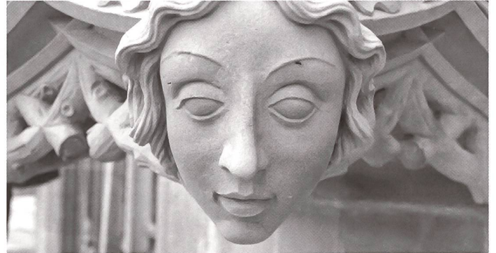
Steinernes Gesicht am Berner Münster: Für die Pflege alter Steinmetzkunst braucht es das Wissen um traditionelles Handwerk.