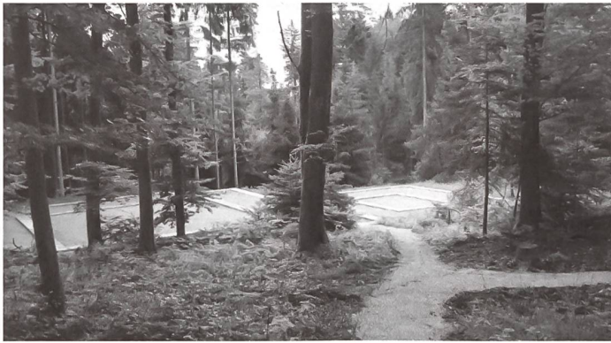
Die Tempel 4 und 6 nach der Instandstellung. Der römische Tempelbezirk auf dem Jäissberg lädt wieder zum Besuch ein. Blick nach Südosten.