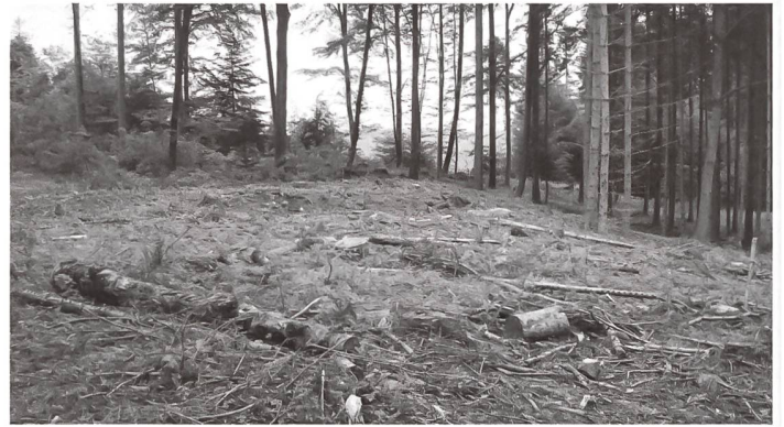
Die Situation bei den Tempeln 4 und 6 vor der Instandstellung. Die Gebäudegrundrisse sind vorgängig vom Baumbewuchs befreit worden. Blick nach Norden.