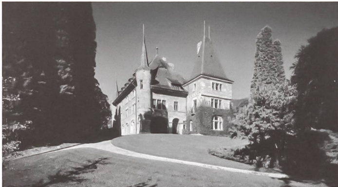
Façade principale du château Mercier, Parc Mercier, Sierre.