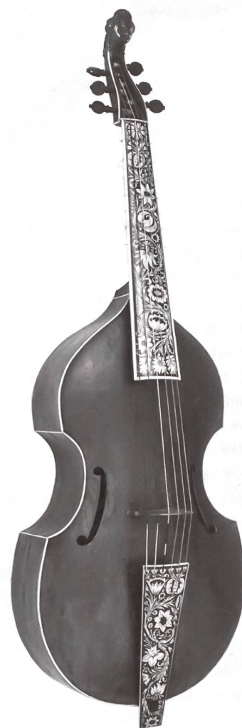
Viola da gamba von Joachim Tielke, Hamburg um 1704.

Die im Zitat genannte Viola da gamba etwa ist ein Streichinstrument, im Aussehen ähnlich der bekannten Violinfamilie,