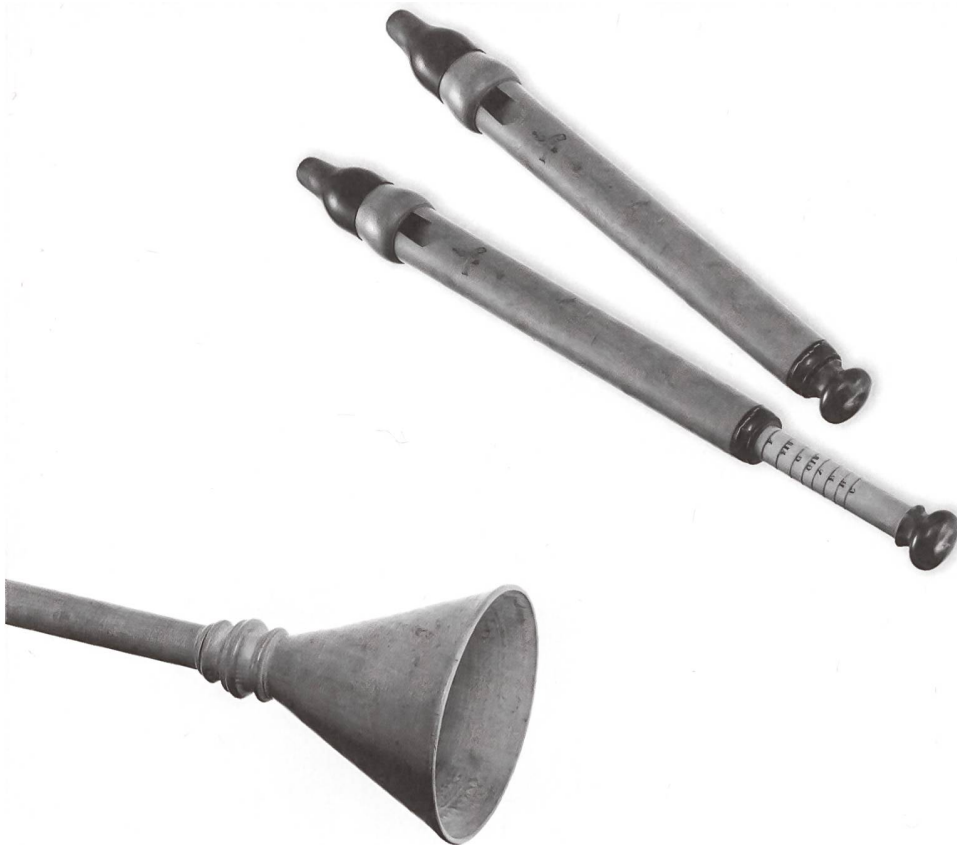
Stimmflöte der Firma Hirsbrunner, Sumiswald aus der 1. Hälfte des 19. Jahrhunderts; links mit ausgezogenem Stempel.