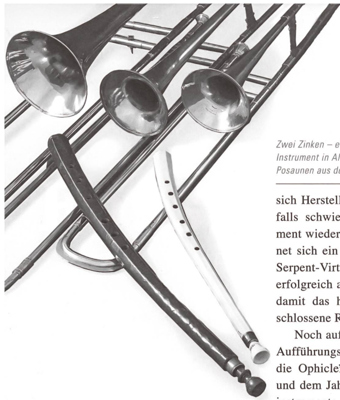
Zwei Zinken – ein Cornettino aus Elfenbein und ein Instrument in Altlage, beide anonym – mit drei Posaunen aus dem 18. Jahrhundert im Hintergrund.

zunehmend marginalisiert. Ihr wichtiges Repertoire aber, als Konsort- wie als Soloinstrument von der Renaissance bis zum Spätbarock, löste schon vor fast 100 Jahren eine Wiederentdeckung aus. Die speziellen Klangmöglichkeiten der Viola da gamba, von Zeitgenossen etwa als «ungeheim mild, angenehm und wohlklingend» (Gustav Schilling. Encyclopedie der gesamten musicalischen Wissenschaften . Stuttgart 1836) gerühmt, lassen sich nicht ersetzen, sondern sind an das Instrument gebunden.