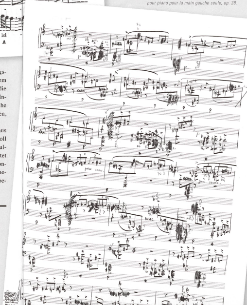
RISM katalogisiert auch neuere Musikquellen des 20. Jahrhunderts. Hier als Beispiel ein Autograph (1939) des Schweizer Komponisten Raffaele d'Alessandro: Sonatine pour piano pour la main gauche seule , op. 28.