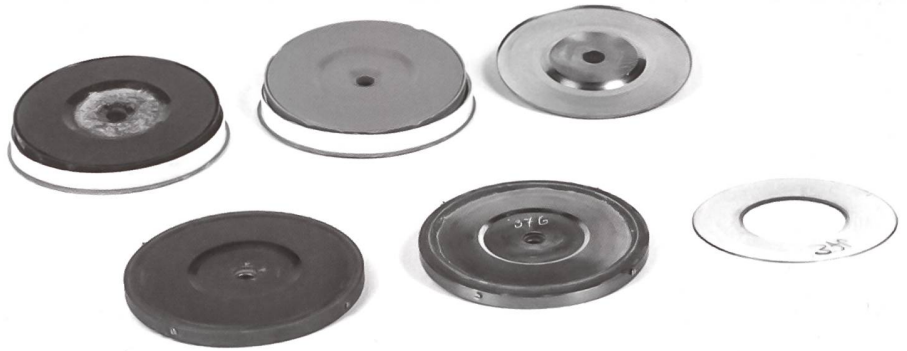
Phonogramplatten und Matrize.

Schweiz im Vergleich zu anderen Ländern erst spät eingesetzt hat, besteht hier noch ein erheblicher Nachholbedarf.