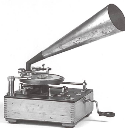
Wiener Archiv-Phonograph Typ 5.

führt und archiviert, ist das Phonogrammarchiv der Österreichischen Akademie der Wissenschaften, das 1899 seine Tätigkeit aufnahm. Seine Aufgaben wurden damals wie folgt umschrieben: «Systematische Dokumentation der europäischen, aber auch aussereuropäischen Sprachen und Dialekte», dann sollte es sich auch der «vergänglichsten aller Kunstleistungen, der Musik» widmen, insbesondere «Musikvorträge wilder Völker» sammeln; schliesslich sollten «Aussprüche, Sätze und Reden» berühmter Persönlichkeiten aufgenommen und für die Zukunft bewahrt werden. Ähnlichen Aufgaben widmeten sich auch die Phonogrammarchive, die 1900 in Berlin und 1926 in St. Petersburg gegründet wurden. Mit ihrer Aufnahme ins Memory of the World Register der Unesco wurde die Bedeutung dieser Sammlungen als Weltkulturerbe anerkannt.