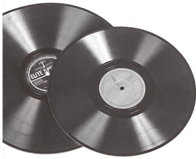
Schellackplatten der Schweizer Marke Elite.