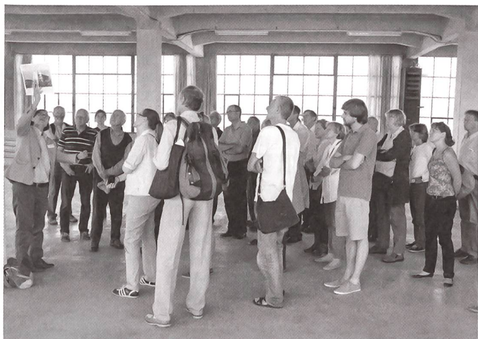
Visiteurs dans les anciennes usines Bata à Möhlin (AG).

50 000 personnes ont visité, les 8 et 9 septembre, la 19 e édition suisse des Journées européennes du patrimoine. Ces deux matériaux du quotidien à l'affiche cette année, ont attiré un grand public.