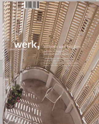
5|12 Balkone und Loggien