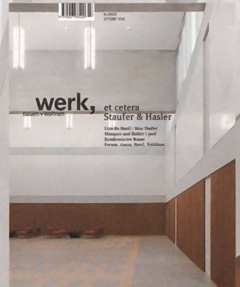
6|12 et cetera Stauer & Hasler

Bestellen Sie ein kostenloses Ansichtsexemplar orders@wbw.ch www.wbw.ch