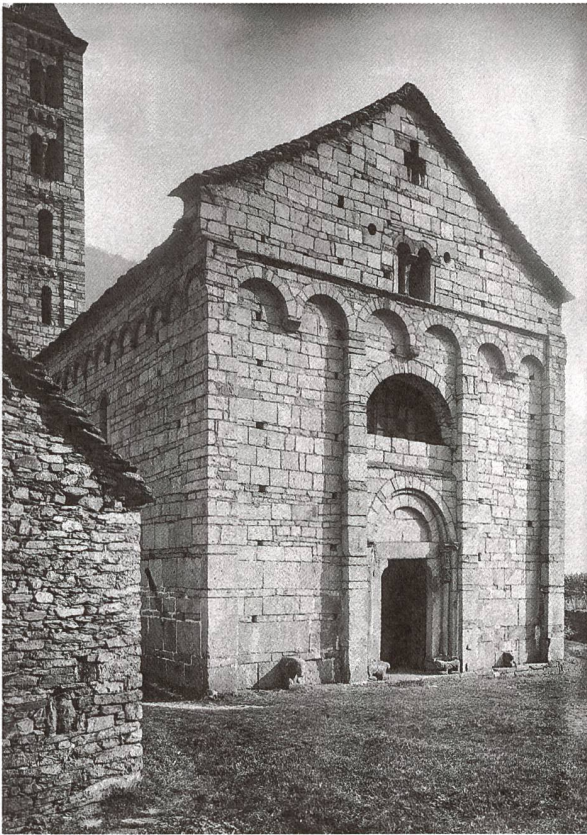
Facciata, lunettone barocco, prima dei restauri del 1945.

romeo pubblica le sue «Istruzioni riguardo l'arredo delle chiese»; il trattato prescrive la disposizione di una grande finestra circolare in facciata come fonte di illuminazione principale. 5 Probabilmente il grande lunettone al di sopra del portale occidentale fu aperto in epoca barocca per dare più luce alla navata a seguito di queste indicazioni che intendevano aumentare l'apporto luminoso nelle chiese. Il lunettone in seguito fu tamponato durante i restauri conclusi nel 1945, lavori che restituirono alla chiesa la sua «penombra romanica».