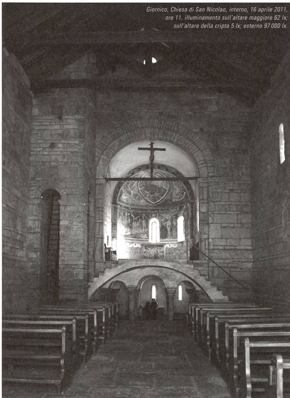
Giornico, Chiesa di San Nicola, interno, 16 aprile 2011, ore 11, illuminamento sull'altare maggiore 62 lx; sull'altare della cripta 5 lx; esterno 97 000 lx.