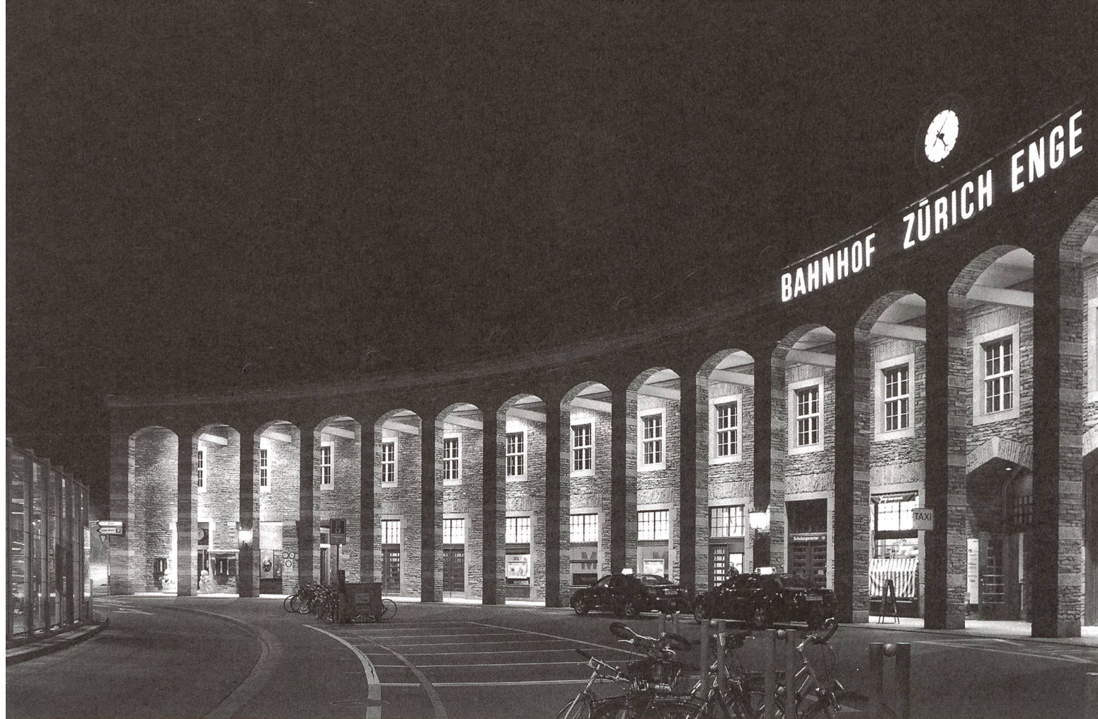
Beleuchtung Tessinerplatz und Bahnhof Enge.

Energieverbrauch und Unterhalt sparsame Technologien wie die LED (Light Emitting Diode) verleihen der Entwicklung zusätzlich Schub.