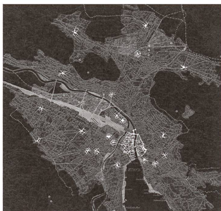
Lichtplan der Stadt Zürich.

Die Beleuchtungen sollen auf die örtlichen Gegebenheiten Rücksicht nehmen und die Orientierung und das Sicherheitsgefühl im öffentlichen Raum stärken. Sie sollen verborgene Qualitäten enthüllen, Emotionen wecken und der Dämmerung und den frühen Nachtstunden eine eigene attraktive Stimmung verleihen.