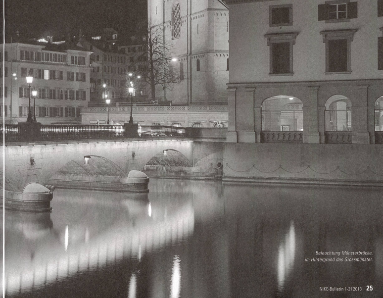
Beleuchtung Münsterbrücke, im Hintergrund das Grossmünster.