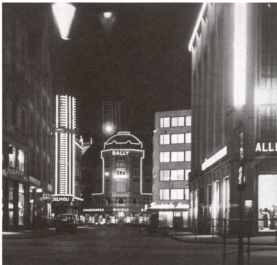
Lichtwoche Zürich 1932.

druckte 1932 die «Lichtwoche» mit einem vielfältigen Programm an Gebäudebeleuchtungen in der Innenstadt. Der zweite Weltkrieg bedeutete für die Bewegung aber ein abruptes Ende. Im Zuge des wirtschaftlichen Aufschwungs der 50er- und 60er-Jahre gewann die Stadtbeleuchtung zwar wieder an Bedeutung, ihre Anwendung reduzierte sich aber meist auf das Funktionale. Erst Mitte der 80er-Jahre wurde auch der gestalterische Aspekt wieder stärker beachtet und seit Ende der 90er-Jahre hat die nächtliche Inszenierung des Urbanen wieder deutlich an Bedeutung gewonnen. Die Ausweitung der kommerziellen Nutzung des öffentlichen Raums, die längeren Ladenöffnungszeiten und die wachsenden Ansprüche unserer Freizeitgesellschaft an den Stadtraum haben den Einsatz von Kunstlicht weiter vorangetrieben. Neue im