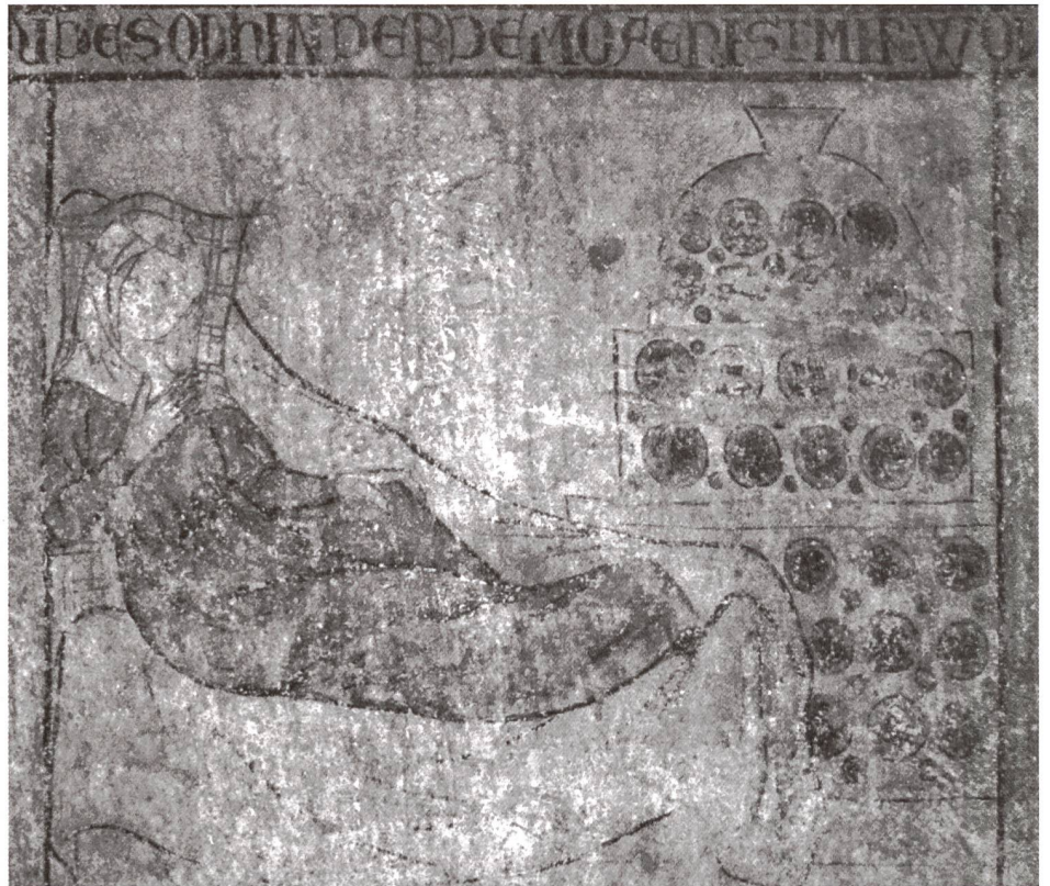
Abb. 3: Konstanz, Haus zur Kunkel, erbaut 1319/1320 (dendrochronologische Datierung), Fresko mit Kachelofendarstellung.

chelblatt – gegen den Raum hin orientiert. Zudem wurden die Schauseiten der Pilzkacheln und der Tellerkacheln erstmals und für die Zukunft richtungweisend mittels Modeltechnik verziert, so dass sich ab dem zweiten Drittel des 14. Jahrhunderts für die Kachelöfen verschiedenste Gestaltungsmöglichkeiten eröffneten (Abb. 5).