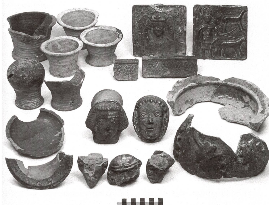
Abb. 5: Auswil, Burgruine Rohrberg, Fundensemble mit Napf-, Pilz-, Teller-, Gesims- und Blattkacheln sowie einem Ofenaufsatz. Aufbewahrungsort Bernisches Historisches Museum.

Eva Roth Heege. Ofenkeramik und Kachelöfen. Typologie, Terminologie und Rekonstruktion im deutschsprachigen Raum (CH, D, A, FL) mit einem Glossar in siebzehn Sprachen. (Schweizer Beiträge zur Kulturgeschichte und Archäologie des Mittelalters 39), Basel 2012.