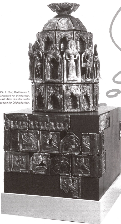
Abb. 1: Chor, Martinsplatz 6, Depotfund von Ofenkacheln. Rekonstruktion des Ofens unter Verwendung der Originalkacheln.