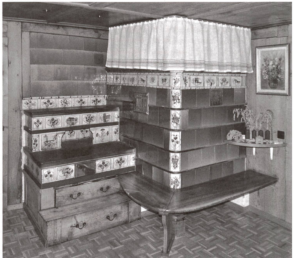
Abb. 4: Boswil, Privathaus, Kachelofen aus der Werkstatt des Hafners Heinrich Notter aus Boswil, datiert 1831.

Ab dem mittleren 15. Jahrhundert besaß der zweigliedrige Turmofen eine vollständige keramische Hülle und der Ofenlehm wurde ins Innere des Ofens «verbannt». Bestehende Kacheltypen wurden in ihrer Funktionalität optimiert und weitere Gliederungselemente hinzugefügt. So findet man am Unterbau des hier dargestellten Turmofens aus dem späten 15.