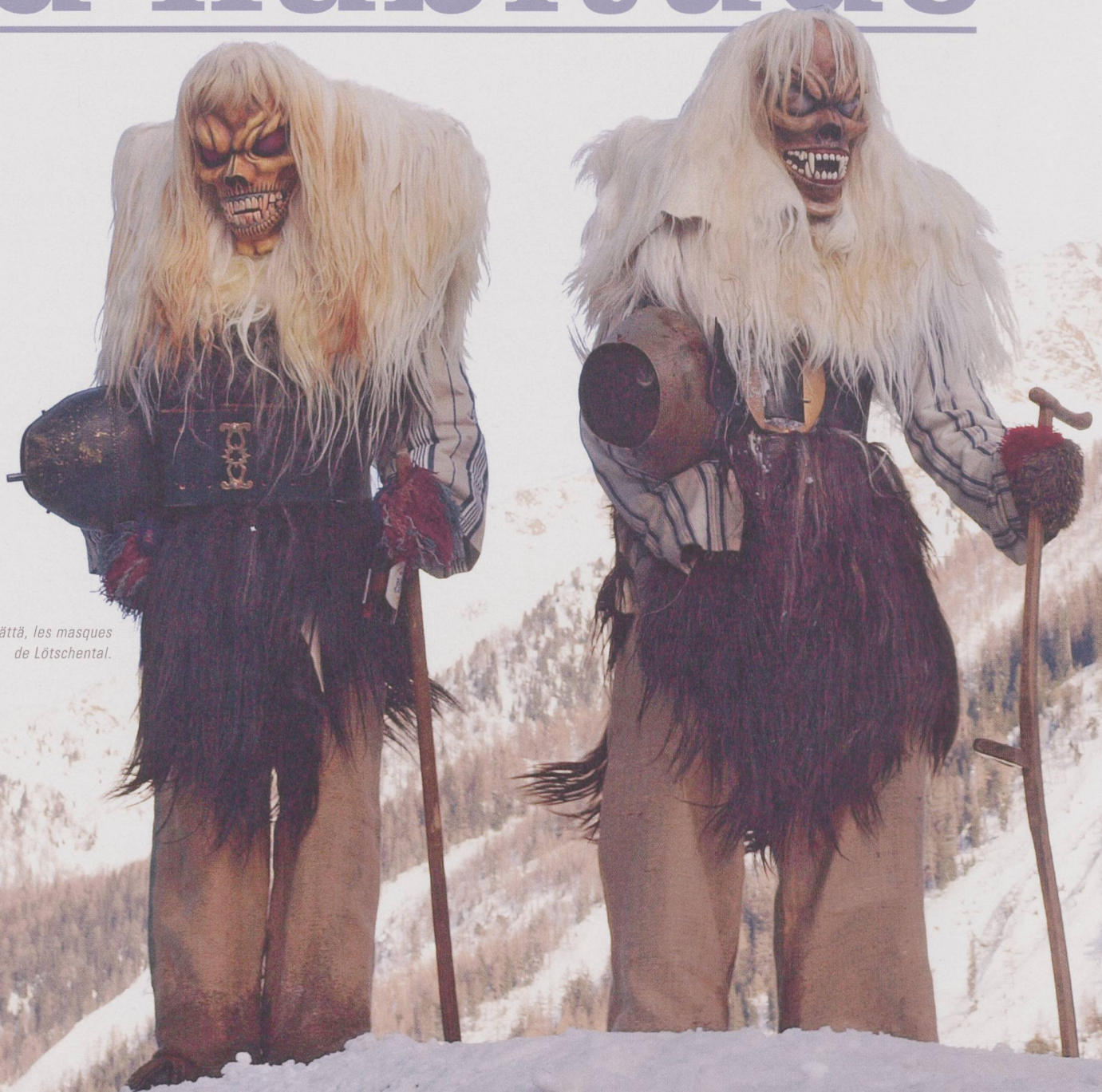
Tschägätsch, les masques de Lötschental.