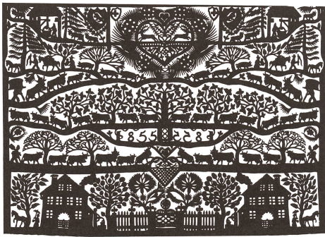
Découpages par J.-J. Hauswirth de 1855 ...

érigées par les sociétés pour se forger la conviction qu'il existe bel et bien des frontières entre elles, pour leur permettre de concevoir leur singularité. Ainsi, l'identité collective ne semble pas concevable sans une extériorité qui lui est constitutive sans lui être propre: nous nous constituons en Suisses autant en référence à ce que nous «sommes» qu'en nous distanciant de ce que nous ne «sommes pas»: ni français, ni allemands, ni italiens.