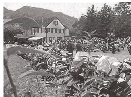
Töfftreff Hauenstein (SO).