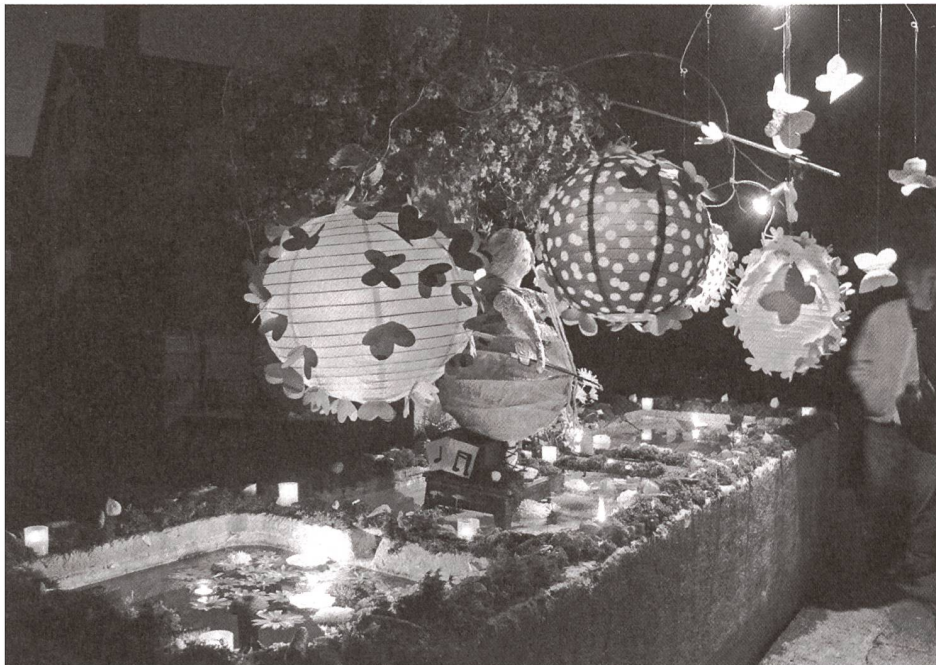
La fête des fontaines à Môtiers (NE).

passée maître. Sur un fond de problèmes et de solutions communs à la plupart des pays européens, la Suisse joue la carte de la différence – le fameux Sonderfall devenu non seulement un emblème mais également un engin de sa différenciation. Certes, l'histoire de la Suisse est différente de celle de ces voisins européens (le contraire est vrai aussi), et son ambivalence par rapport à la chose «nationale» s'explique en bonne partie à travers cette histoire. Mais elle s'est tout de même dotée entre temps d'un gouvernement fédéral qui, s'il n'est pas centralisé de la même manière qu'en France, n'est pas non plus compréhensible à la lumière du mythe de l'autonomie locale ou cantonale. Son économie aussi est nationale et mondialisée, ses habitants viennent, pour une partie respectable entre eux, du monde entier et les pratiques culturelles de ses citoyennes puisent leur inspiration autant dans l'imaginaire des «hoods» de Los Angeles que dans l'air pur de nos montagnes.