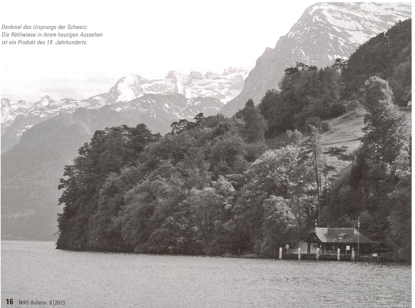
Denkmal des Ursprungs der Schweiz: Die Rütliwiese in ihrem heutigen Aussehen ist ein Produkt des 19. Jahrhunderts.

Nur wenigen Denkmälern in unserem Land kommt der Rang eines Schweizer Erinnerungsortes zu. Dennoch existieren sehr viele Denkmäler, die für eine stattliche Zahl von Menschen mit persönlicher oder kollektiver Erinnerung und Bedeutung behaftet sind. Die Bewohnerinnen und Bewohner einer Stadt etwa mögen