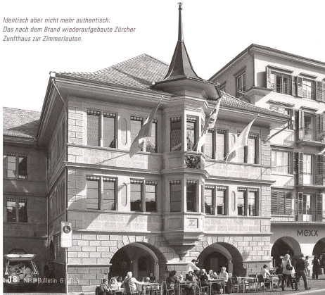
Identisch aber nicht mehr authentisch. Das nach dem Brand wiederaufgebaute Zürcher Zunfthaus zur Zimmerleuten.