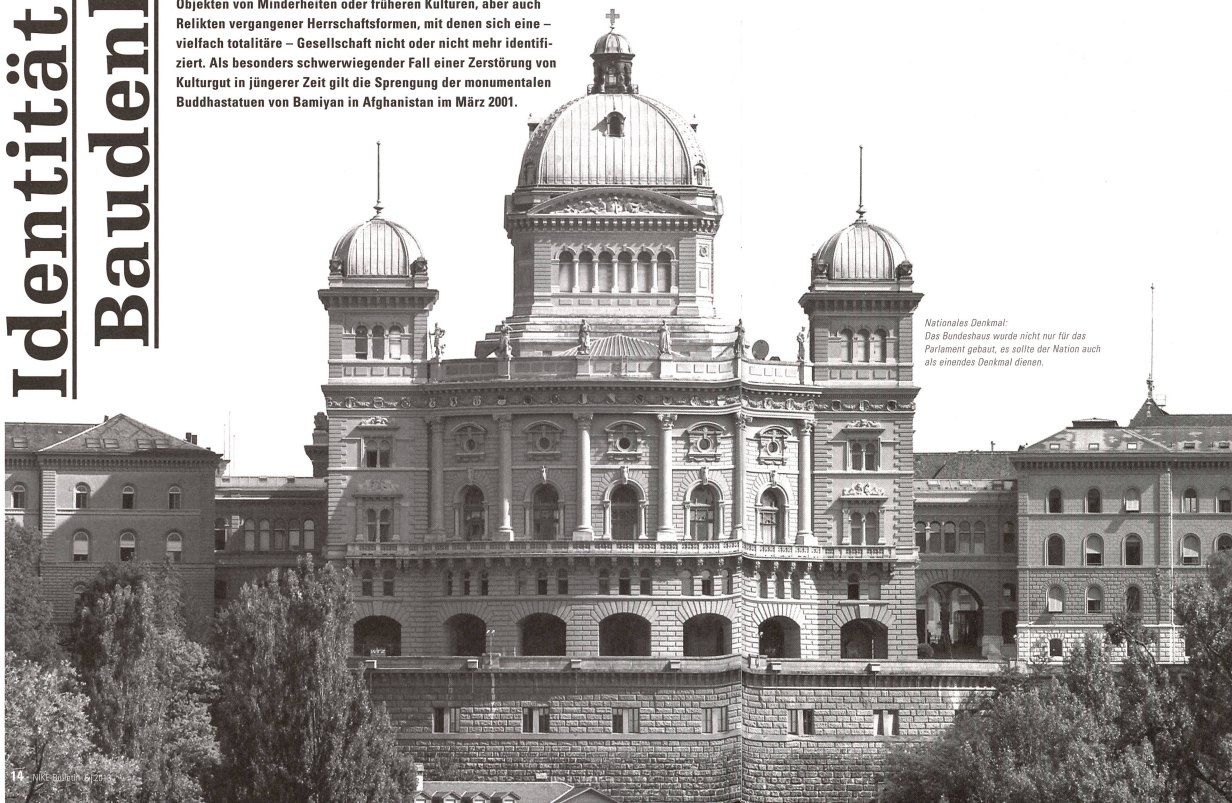
Nationales Denkmal: Das Bundeshaus wurde nicht nur für das Parlament gebaut, es sollte der Nation auch als einheits Denkmal dienen.

Eine Gesellschaft identifiziert sich mit ihrer Geschichte. Sie erkennt und interpretiert bauliche Strukturen, die von dieser Geschichte zeugen, als Denkmäler, und schützt sie. Bauten, die sie in Bezug auf den geschichtlichen Wert für unbedeutend hält oder die gar ihrem Geschichts- und Selbstverständnis widersprechen, werden oft nicht geschützt, manchmal sogar bewusst zerstört. Diese Gefahr droht in besonderem Masse kulturellen Objekten von Minderheiten oder früheren Kulturen, aber auch Relikten vergangener Herrschaftsformen, mit denen sich eine – vielfach totalitäre – Gesellschaft nicht oder nicht mehr identifiziert. Als besonders schwerwiegender Fall einer Zerstörung von Kulturgut in jüngerer Zeit gilt die Sprengung der monumentalsten Buddhastatuen von Bamiyan in Afghanistan im März 2001.