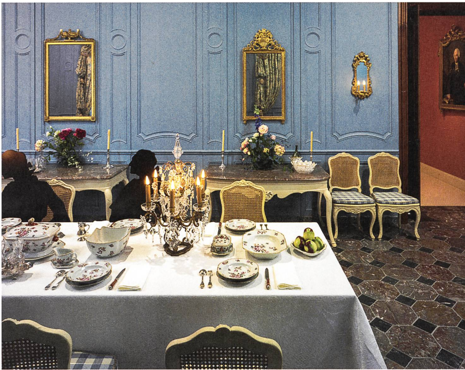
Vue de la table dressée avec un service en porcelaine de Chine à décor «famille rose», vers 1770.

plusieurs jours comme le montre cet extrait en date du 27 juillet 1780: «Un Monsieur Schickart de Tubingen nous apporte une lettre écrite en 1778, lettre de recommandation de notre frère Charles (...): il lui a été fait accueil comme de droit, donné à dîner, retenu à souper et coucher pour repartir le lendemain matin sur son cheval.»