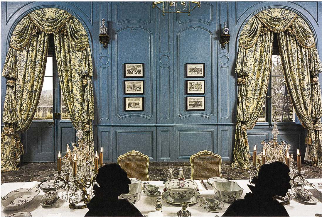
Vue de la grande salle à manger avec les croisées et les rideaux d'indienne.

la salle datent probablement de la seconde moitié des années 1750 1 : la tenture de cuir doré cède la place à des boiseries et le poêle 2 à une fontaine de marbre à double vasque. Comme celle-ci est indissociable du sol de marbre, elle a certainement été posée en même temps.