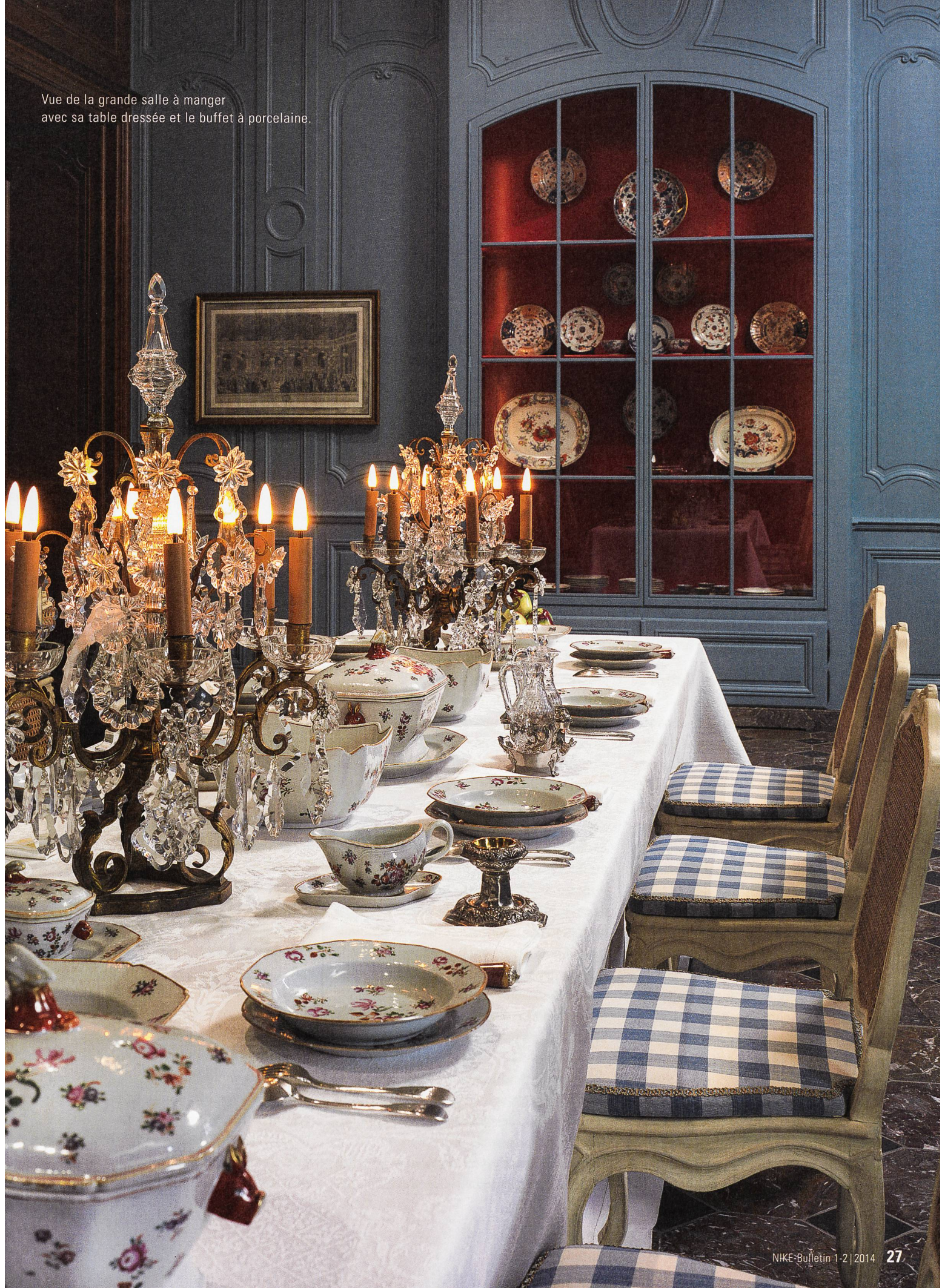
Vue de la grande salle à manger avec sa table dressée et le buffet à porcelaine.