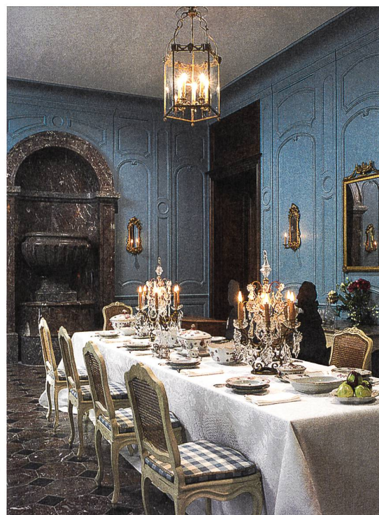
Vue de la grande salle à manger avec son sol et sa fontaine en marbres polychromes du Chablais.

Le château de Prangins fut construit entre 1732 et 1739 par Louis Guiguer, un banquier et financier d'origine saint-galloise établi à Paris. La première mention de la salle à manger date de 1748 et figure dans l'inventaire des biens dressé au décès du baron Guiguer. Dans ce document, la pièce est une des seules dont la fonction soit précisée, la plupart des autres étant nommées indifféremment «chambres». Ce n'est en effet qu'au cours du XVIII e siècle qu'une spécialisation des espaces va progressivement se mettre en place et que l'on commence à distinguer les salles dédiées à la vie publique de celles réservées à la sphère privée. La dénomination de «chambre à manger carrelée de marbre» apporte une première information concernant le décor de cette pièce. Au sol de marbre s'ajoute encore une «tapisserie de cuir doré et argenté», «huit fauteuils et douze chaises de canne» et un «buffet de service [où se] trouve la vaisselle de porcelaine».