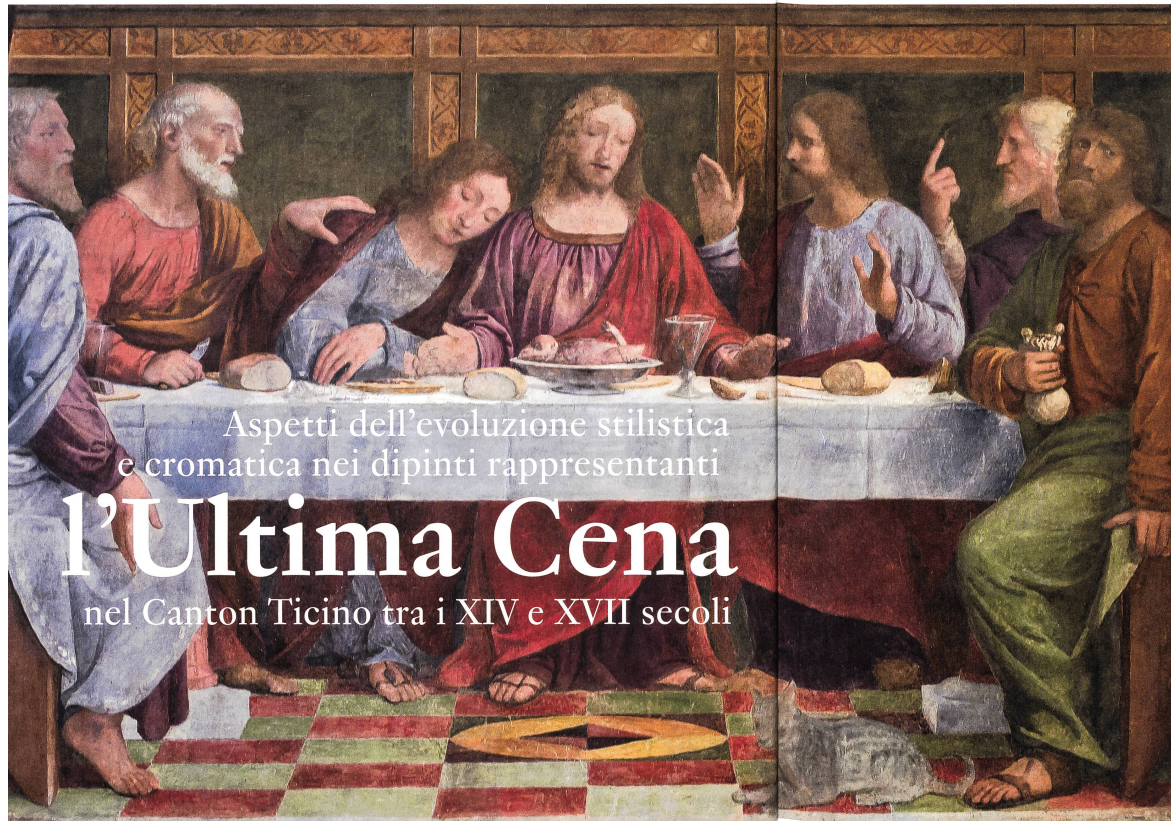
Dettaglio del Cenacolo di Bernardino Luini a Lugano.