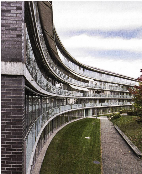
Die Überbauung Hintere Bahnhofstrasse bildet eine städtebaulich klare Trennung von Innenstadt und durchgrünter Wohnstadt

Der Wakkerpreis des Schweizer Heimatschutzes geht dieses Jahr an Aarau. Die Hauptstadt des Kantons Aargau erhält die Auszeichnung für ihre sorgfältigen Verdichtungsmassnahmen, die gleichzeitig die Identität der einzelnen Stadtquartiere bewahrt. Dank der Festlegung sowohl quantitativer als auch qualitativer Massnahmen bei der Quartierentwicklung bleibt Aaraus städtebauliche Vielfalt erhalten und leistet so einen wichtigen Beitrag zur Lebensqualität der Stadt.