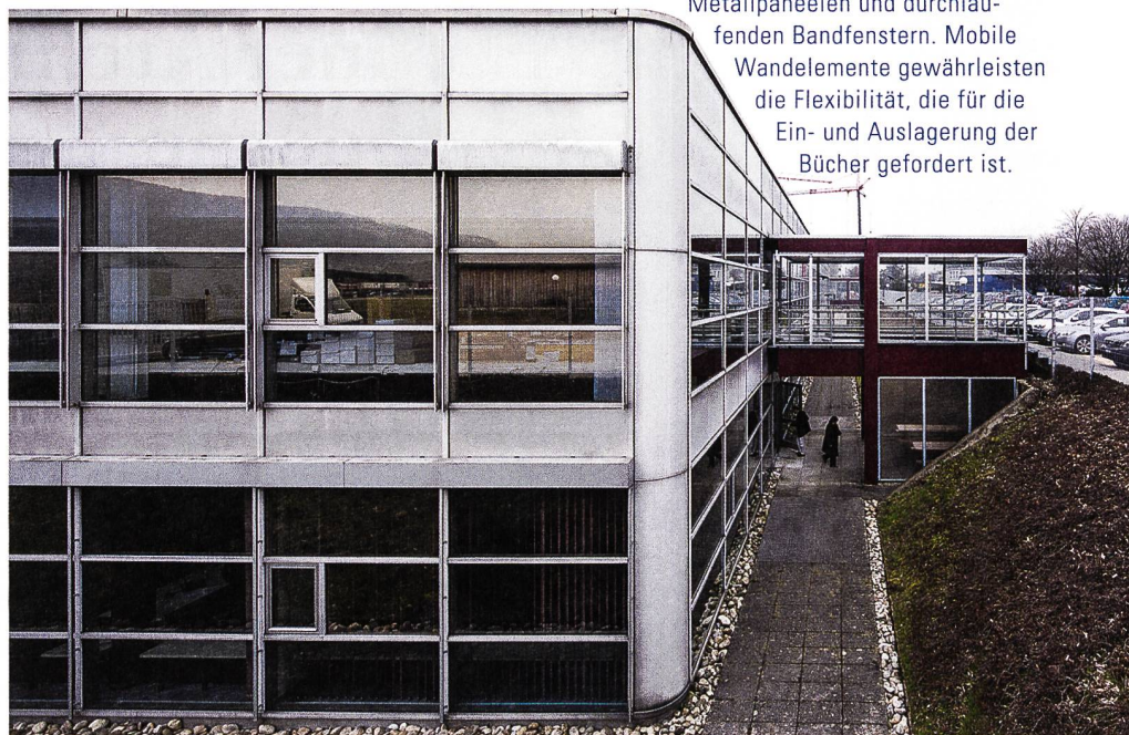
Schweizer Buchzentrum Hägendorf, 1973–1975 von Alfons Barth & Hans Zaugg: Das Stahlskelett über dem quadratischen Grundriss basiert auf einem durchgehenden Rastermodul von 7,2 Metern. Die vorgehängten Fassaden zeigen ein gleichmässiges Gitterbild aus silbergrauen Metallpaneelen und durchlaufenden Bandfenstern. Mobile Wandelemente gewährleisten die Flexibilität, die für die Ein- und Auslagerung der Bücher gefordert ist.

tische Auswertung bekräftigen allgemeine Erkenntnisse. Innerhalb der vier Jahrzehnte überwiegen die Bauten der 1950er- und 1960er-Jahre, die zusammen zwei Drittel ausmachen. Unter den Baugattungen führen Wohnhäuser vor den Schulgebäuden das Feld an. Und in den Städten Grenchen, Solothurn und Olten stehen – in dieser Rangierung – zusammen gegen die Hälfte aller Objekte.