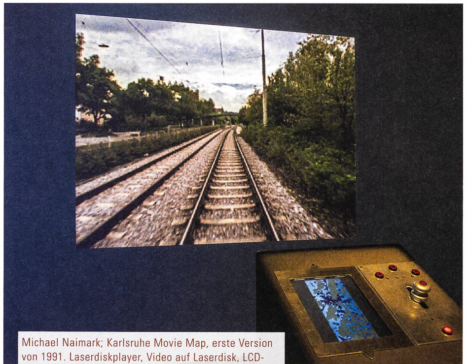
Michael Naimark; Karlsruhe Movie Map, erste Version von 1991. Laserdiskplayer, Video auf Laserdisk, LCD-Projektor, Apple Macintosh Ilci, Serielle Einhandsteuerung, 4 rote Industrietaster, HyperCard, Software. Dimensionen: Installationsfläche: 1,85 x 3 m, Rückprojektion: 1,63 x 1,80 m, ZKM Karlsruhe. Die Zuschauer können in dieser frühen interaktiven Installation die Fahrt selber bestimmen, die aus tausenden Einzelbildern des gesamten Streckennetzes der Strassenbahnen von Karlsruhe nach den Befehlen am Steuerpult zusammengesetzt wird. Die Einzelbilder waren im Zeitraffer auf 16mm Film aufgenommen worden. Eine aktualisierte Version ist digital in HD und 3D aufgenommen und läuft ab Festplatte. Die beiden Versionen bestehen nebeneinander: Die zweite ist aufgrund der Obsoleszenz der Laserdisk hergestellt worden, dabei hat man entschieden, die erste auch zu erhalten und sie zu diesem Zweck auf Harddisk zu migrieren.