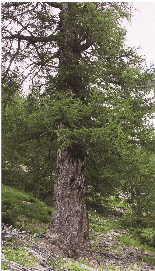
Fig. 3: Le Patriarche de Hittuwald, Simplon-Dorf (VS). Malgré son grand âge, il a près de 1000 ans, ce mélèze est en parfaite santé.