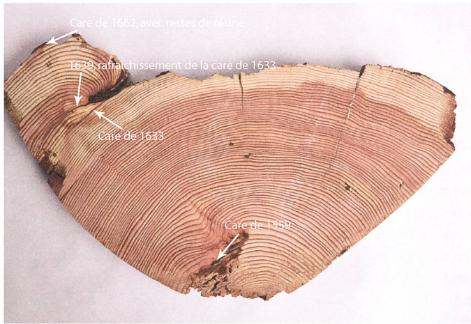
Fig. 6: Tranche BALA-62-18. A l'exception de la care de 1711, toutes les cares les plus anciennes sont visibles sur ce cliché. Les efforts de cicatrization sont particulièrement clairs pour les années 1633 et 1639.

Quelques carottages effectués le long de la bille ont apporté les cernes les plus récents et ont ainsi permis de compléter la courbe de croissance moyenne de ce mélèze.