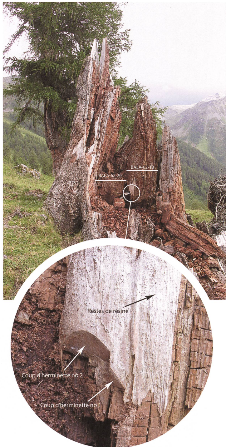
Fig. 5: Balavaux no 62. Le pied de l'arbre, entièrement ouvert, laisse entrevoir deux coups d'herminette (désignés par la pointe de la truelle dans le cercle blanc et l'agrandissement sur la photo d'en bas). Les deux traits blancs (nos 18 et 20) signalent la position des deux échantillons prélevés à la tronçonneuse.