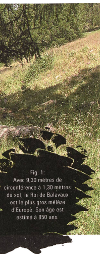
Fig. 1 : Avec 9,30 mètres de circonférence à 1,30 mètres du sol, le Roi de Balavaux est le plus gros mélèze d'Europe. Son âge est estimé à 850 ans.

découverte au début du XX e siècle, la dendrochronologie est une science qui permet l'analyse des anneaux de croissance des arbres. Elle s'attache essentiellement, mais pas exclusivement, à la mesure des cerne, à leur description et à leur ordonnance dans le temps (datation). A titre comparatif, les « codes-barres », inhérent à notre environnement domestique et commercial, sont omniprésents sur les emballages des produits que nous achetons ; ils contiennent toutes les informations essentielles à la gérance de ces derniers. Dans l'environnement naturel qui nous entoure, depuis des milliers d'années, les arbres enregistrent des « codes-cernes », en fonction des influences climatiques qu'ils subissent. Pour les dendrochronologues, dont c'est le métier, le but est de lire et de décrypter ces signaux.