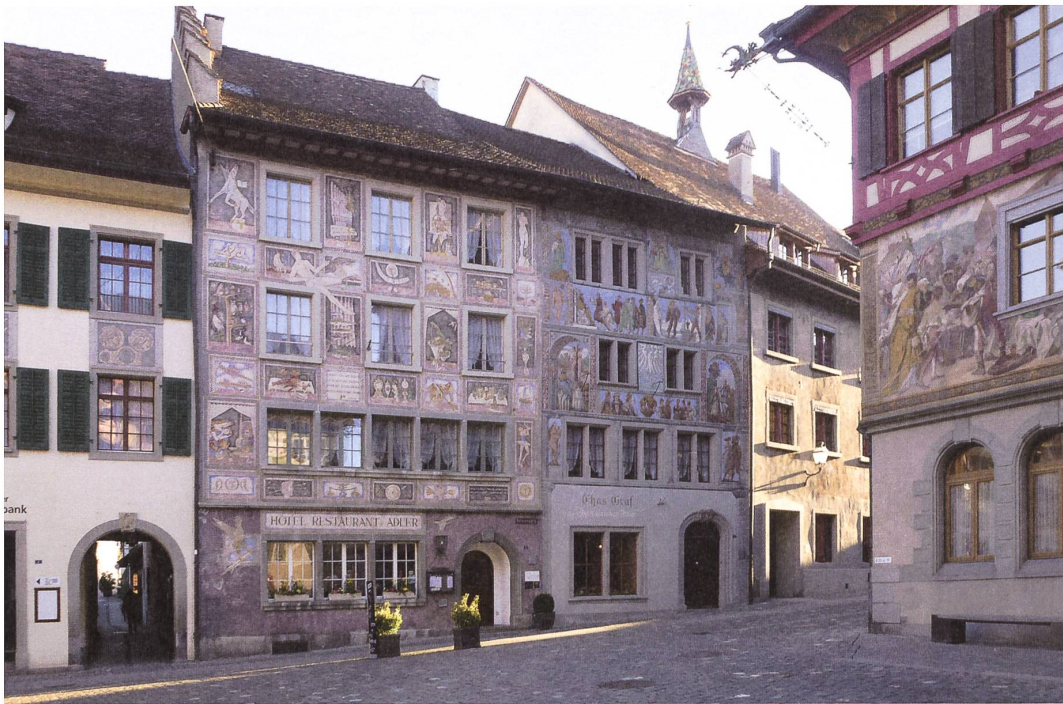
Stein am Rhein, der Rathausplatz mit dem Haus zum Weissen Adler und dem Rathaus.