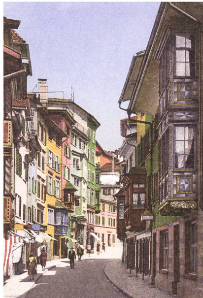
Zürich, Augustinergasse, kolorierte Postkarte.

Die Farbgebung bei der Instandsetzung von historischen Bauten nach restauratorischen und denkmalpflegerischen Grundsätzen macht jedoch nur einen geringen Prozentsatz der Farbkultur eines Ortes aus. Siedlungswachstum und Siedlungsverdichtung zeitigen vielerorts zusammen mit den technischen Möglichkeiten auch einen Wandel