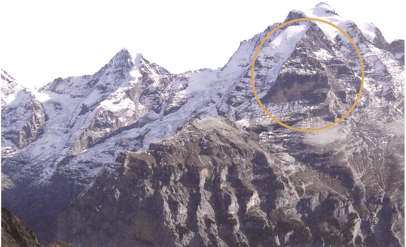
Das Rotbrätt am Fuss der Jungfrau. Im Vordergrund der Schwarzmönch .

können die Namen zum Teil nicht vom Wort Brunne «Quelle, Brunnen» unterschieden werden, das in Zusammensetzungen auch in der verkürzten Form Brunn/Brun vorkommen kann. Schliesslich kann Rot in seltenen Fällen auch von schweizerdeutsch Rod , einer gekürzten Form von Gerod , Grod «Rodung» herrühren.