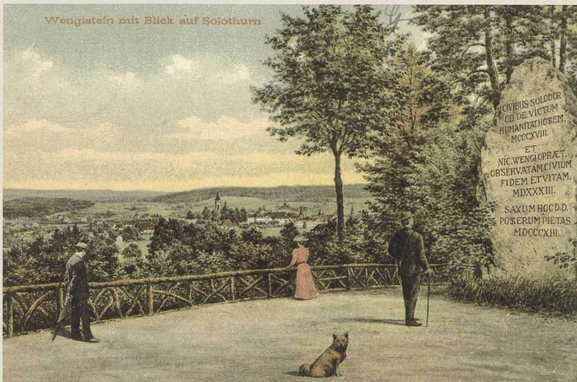
Abb. 3: Der Wengistein auf dem Känzeli mit Blick auf Solothurn, Postkarte 1908.