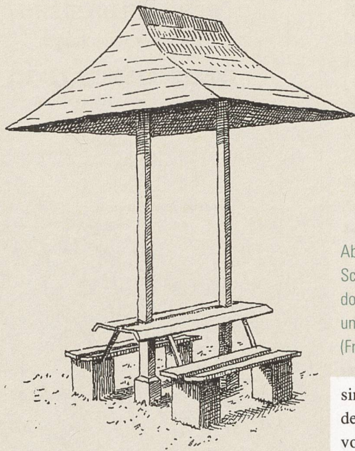
Abb. 5: Bank mit Schirmdach aus Theodor Felbers Buch Natur und Kunst im Walde (Frauenfeld 1906).