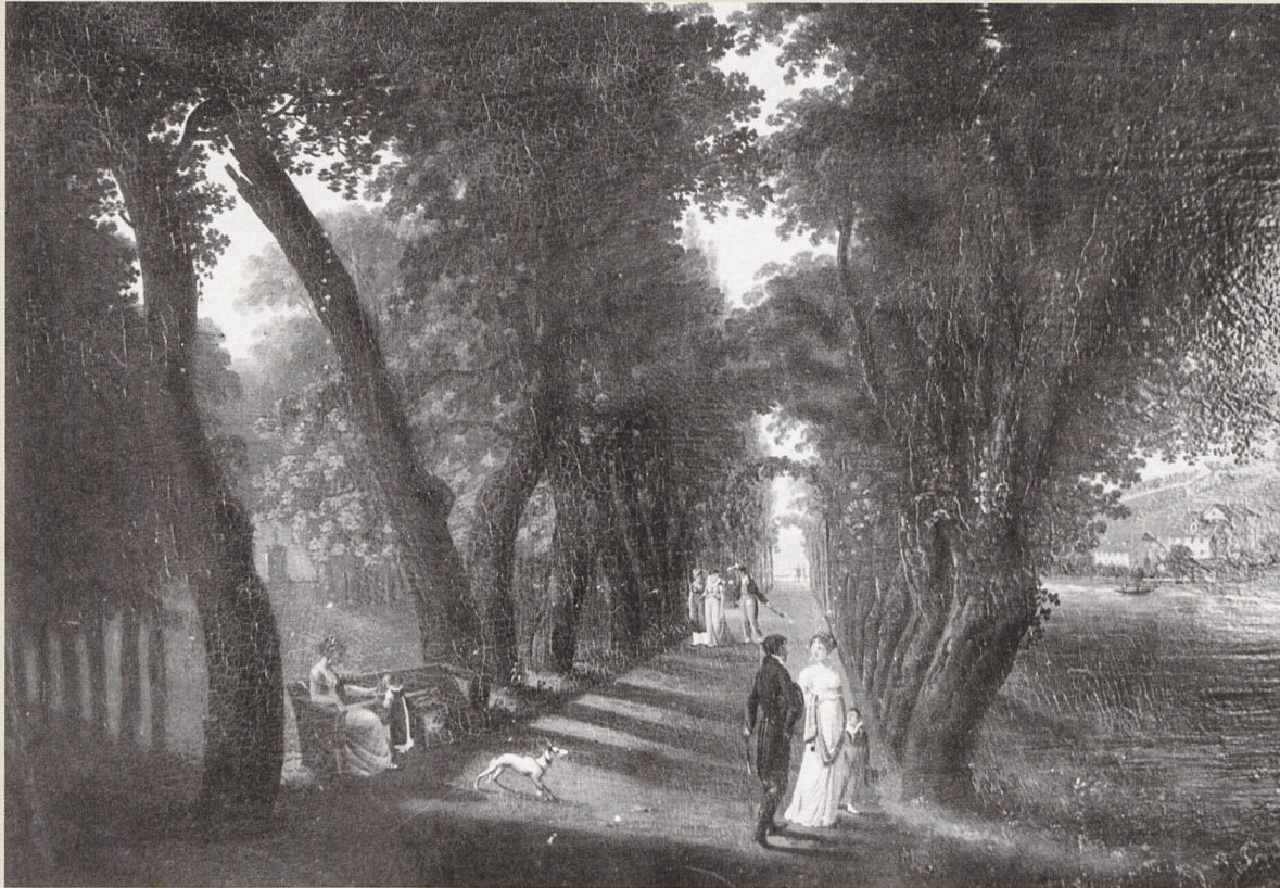
Abb. 2: Promenade im Platzspitz in Zürich, um 1815. Ölbild von Johann Caspar Rahn (1769–1840).