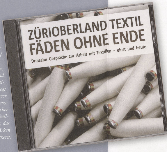
Die CD Zürioberland Textil – Fäden ohne Ende war eines der ersten Projekte von «Zürioberland Kulturerbe».

Regionales Kulturerbe zu pflegen ist eine Aufgabe, welche schweizweit auf den Agenden zahlreicher Organisationen, Institutionen und kantonaler Ämter steht. Wie aber können – neben Sammlungen kulturhistorischer Museen, denkmalpflegerisch geschützten Gebäuden und archäologischen Stätten – die regionalen Traditionen und das lokale Brauchtum erhalten, gepflegt und vermittelt werden? Zur Beantwortung dieser Frage wurden in den letzten Jahren eine ganze Reihe von Tagungen organisiert und etliche Bücher publiziert. Im Zürcher Oberland hat es eine zivilgesellschaftliche Initiative beispielhaft geschafft, das Bewusstsein für das regionale Kulturerbe zu stärken und in der Politik breit zu verankern.