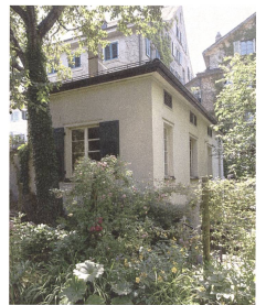
Das Atelier am Neumarkt 11a von aussen 2013.

Aus restauratorischer Sicht wurde der Zustand des Wandbilds nach seiner Freilegung als gut bezeichnet, vorgefundene Schäden wurden nach der Begehung stabilisiert. Das Neumarktatelier wird noch immer als Künstleratelier genutzt: Um den bisherigen Nutzungsumfang für die Mieterin zu sichern, kam das Wandbild erneut hinter eine Wand.