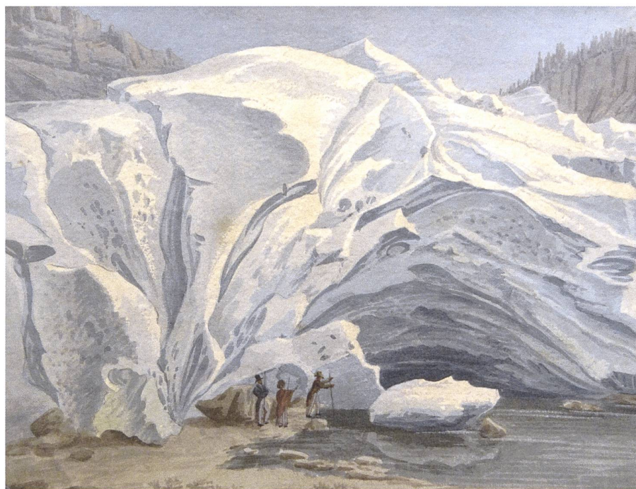
Mongin (1761–1827), der die Alpenwelt nie besucht hatte, für seine Tapeten benutzte. 6