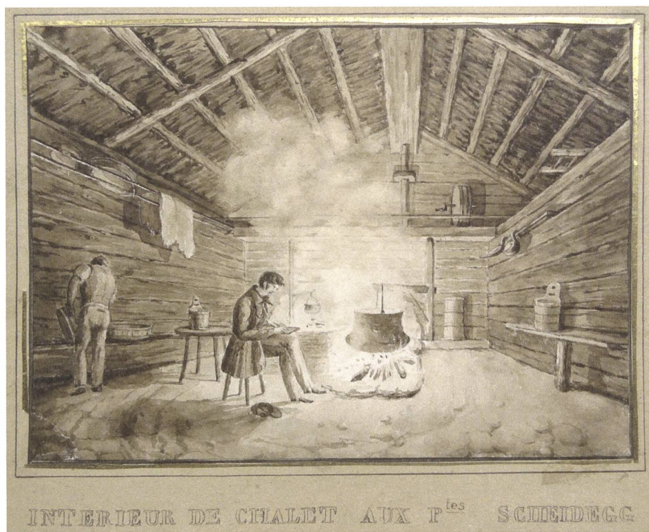
Abb. 4: Anonym: Schreibender Tourist im «Intérieur de chalet aux p tes Scheidegg», Sepia- Aquarell um 1820.

spinnen (Wilderswil BE) auf dem Bödéli zwischen Thuner- und Brienersee.