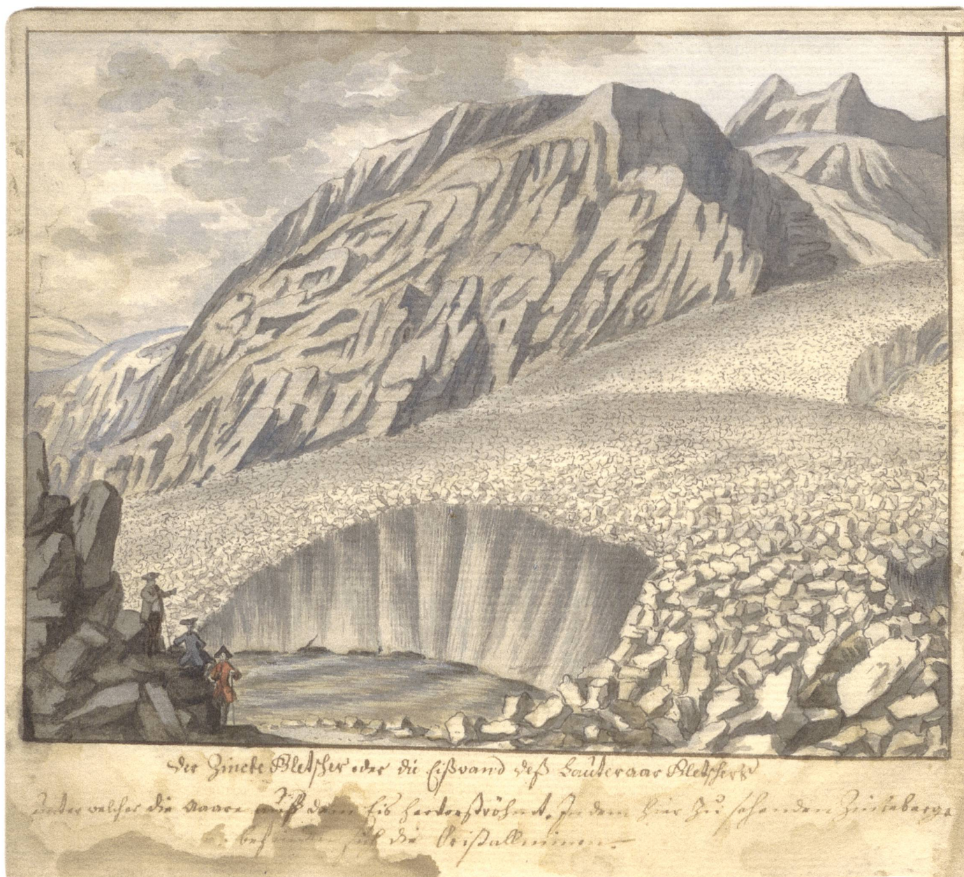
Abb. 1: S. H. Grimm: «Der Zincke Gletscher oder die Eißwand des Lauteraar Gletschers», Aquarell vor 1760.