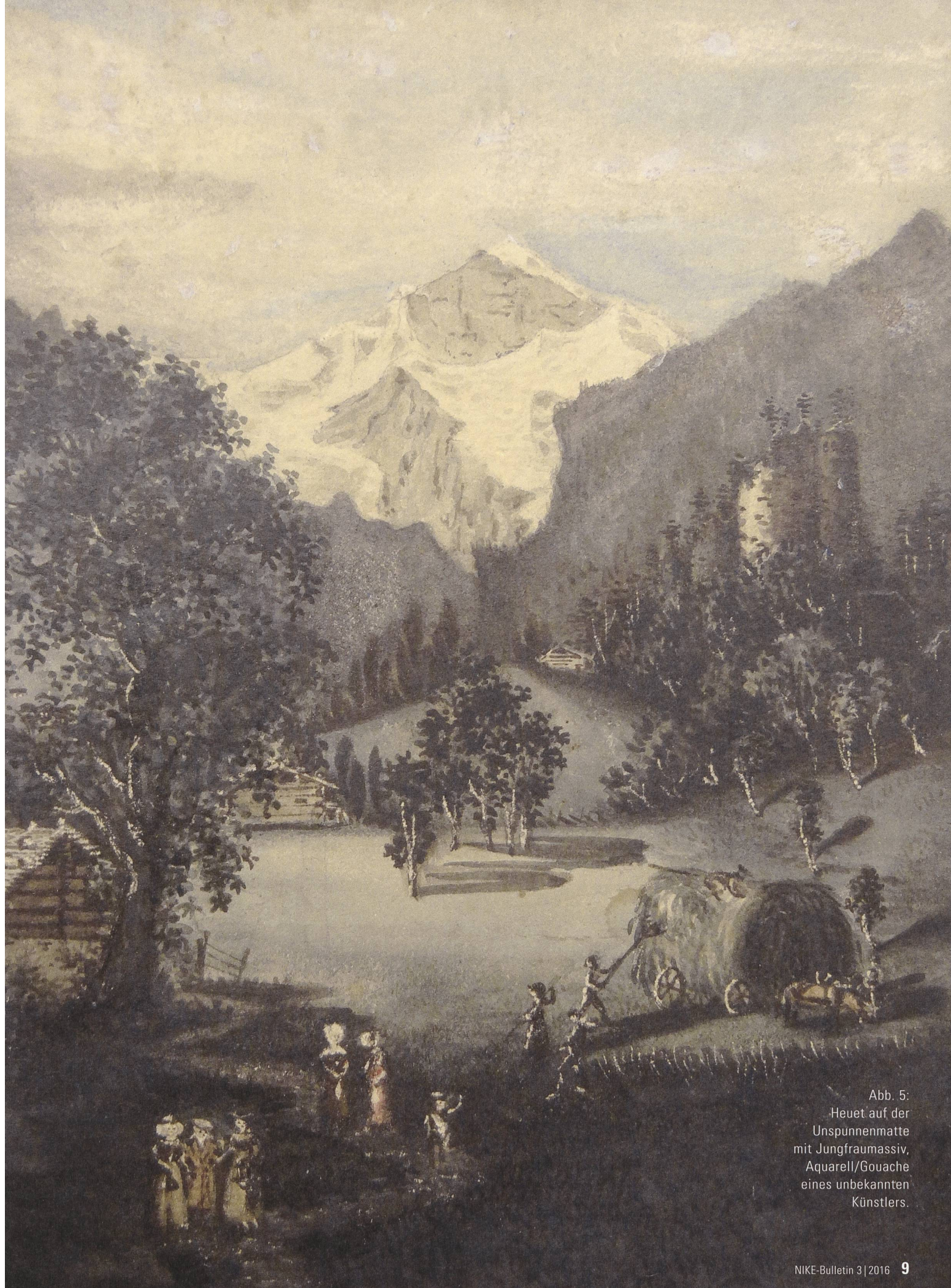
Abb. 5: Heuet auf der Unspinnenmatte mit Jungfraumassiv, Aquarell/Gouache eines unbekannt Künstlers.