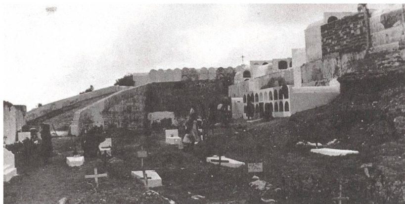
Der Friedhof im südspanischen Dorf Almuñécar um 1958.