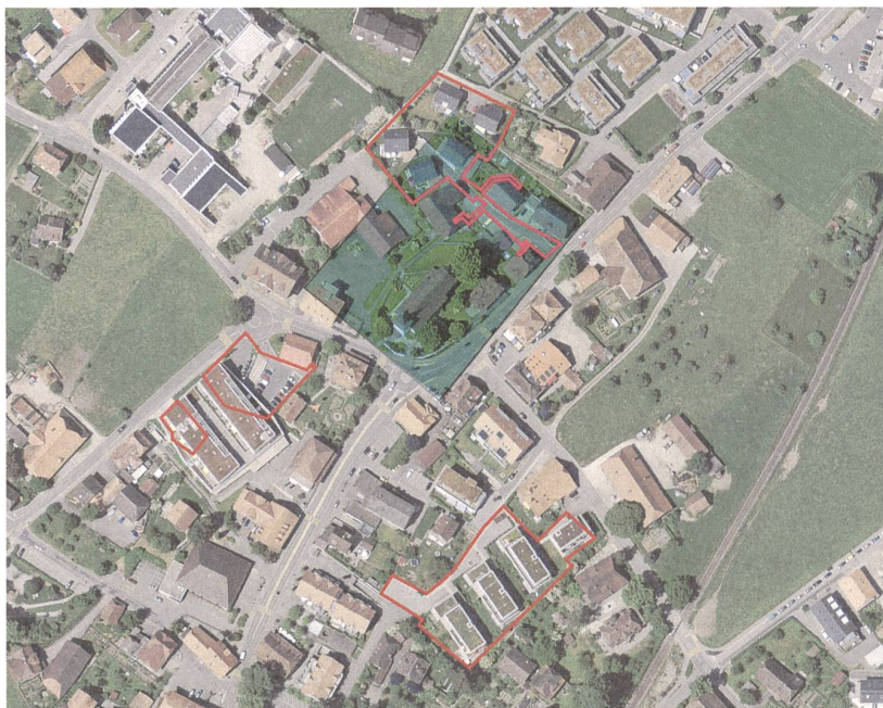
Abb. 3: Rund um die Kirche (Bildmitte) wurden in den Jahren 2006 bis 2010 mehrere grosse Flächen archäologisch untersucht.