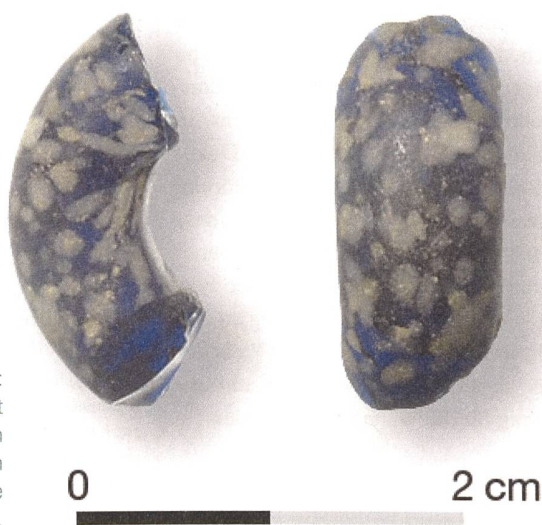
Abb. 4: Aus keltischer Zeit kennen wir einen Hausgrundriss, einen Weg und diese modische Glasperle.

Mit dieser letzten grossen Grabung fanden die archäologischen Untersuchungen im Zusammenhang mit der Erneuerung des Dorfkerns ihren vorläufigen Abschluss. Seither begleitete der ADB vor allem kleine Um- und Anbauprojekte. In anderen Dör- fern aber setzen die verdichtenden Mass- nahmen gerade erst ein – und ziehen weitere umfangreiche Grabungen nach sich.