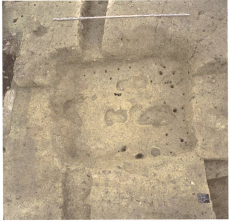
Abb. 5: In diesem in den Boden eingetieften hochmittelalterlichen Webkeller sind noch die Negativdrücke des im Boden verankerten Webstuhls zu erkennen.