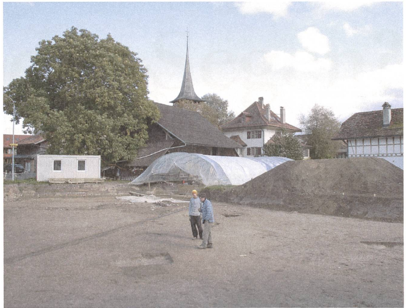
Abb. 2: Eine ehemalige Hostett im Dorfzentrum von Jegenstorf weicht einem Einkaufszentrum – nach der archäolo- gischen Untersuchung der früh- und hochmit- telalterlichen Sied- lungsspuren.