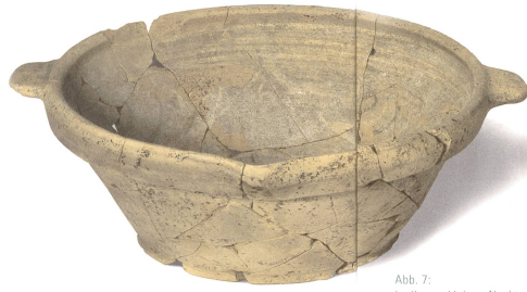
Abb. 7: In diesem kleinen Nachtopf (rechts) wurde eine Nachgeburt (Plazenta) deponiert und mit einer Schüssel (links) überdeckt. Beides zusammen wurde im Boden begraben. Die Schüssel trägt innen die Jahreszahl 1739.

Die Erfahrungen der letzten Jahre zeigen, dass unter den rasch verschwindenden Freiflächen unserer Dörfer unersetzliche Zeitzonen schlummern. Nun gilt es dort, wo archäologische Fundstätten nicht in situ erhalten werden können, deren Dokumentation vor der endgültigen Zerstörung sicherzustellen und zu gewährleisten, dass die Resultate der Grabungen zeitnah durch Auswertungen und Publikationen der Forschung und der Öffentlichkeit zugänglich gemacht werden. Nur so kann der Preis des Verlusts an einzigartiger Originalsubstanz zum Ertrag für die Wissenschaft werden.