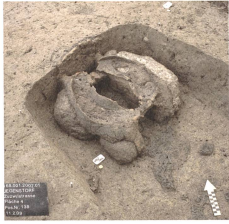
Abb. 6: Ein kleiner Ofen diente zur Herstellung der Form für den Guss einer Glocke.

Der durch die Untersuchungen in Jegenstorf ermöglichte Wissenszuwachs zur Geschichte des Dorfes ist enorm: Zum ersten Mal konnte die Lage und Strukturierung der Siedlung im Früh- und Hochmittelalter erfasst werden (Abb. 8). Zusätzlich liegen neue Erkenntnisse zum römischen Gutshof vor. Erste Schlaglichter fallen ausserdem auf die ältere Geschichte des Ortes, die bis in die Bronze- und Eisenzeit zurückreicht. Die Analysen einiger neuzeitlicher und moderner Grubeninventare belegen, dass auch die jüngere Geschichte unserer Dörfer noch viele Überraschungen birgt, die in den Geschichtsbüchern keinen Niederschlag fanden.