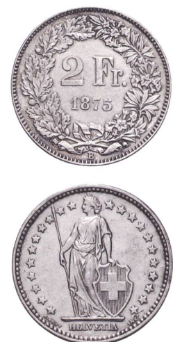
Abb. 4: Antoine Bovy: Silbermünze, Zwei Franken, Bern 1875.