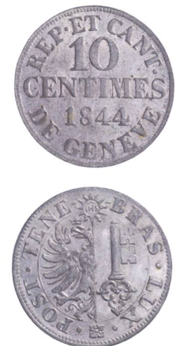
Abb. 3: 10 centimes, Genève, canton, 1844; billon, 2,684g.