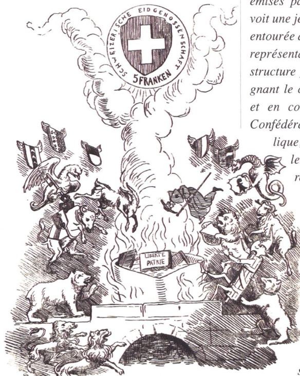
Abb. 7: Anonym. Karikatur zur Münzreform, in: Der Postheiri. Illustrierte Blätter für Gegenwart, Öffentlichkeit und Gefühl 6/12. Solothurn 1850.

So erscheint denn die eidgenössische Machtordnung in der politischen Ikonographie des 19. Jahrhunderts als ein fragiles Arrangement zwischen Bund und Kantonen. Dieses Bild geteilter Macht hat sich der Bundesstaat erfolgreich zu eigen gemacht, wenn er sich in Alltagsbildern wie den Schweizer Münzen bis heute als vielfältige Einheit repräsentiert.