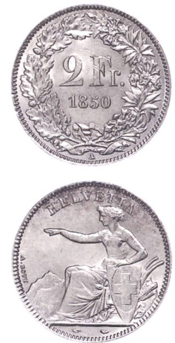
Abb. 2: Antoine Bovy: Silbermünze, Zwei Franken, Paris 1850.